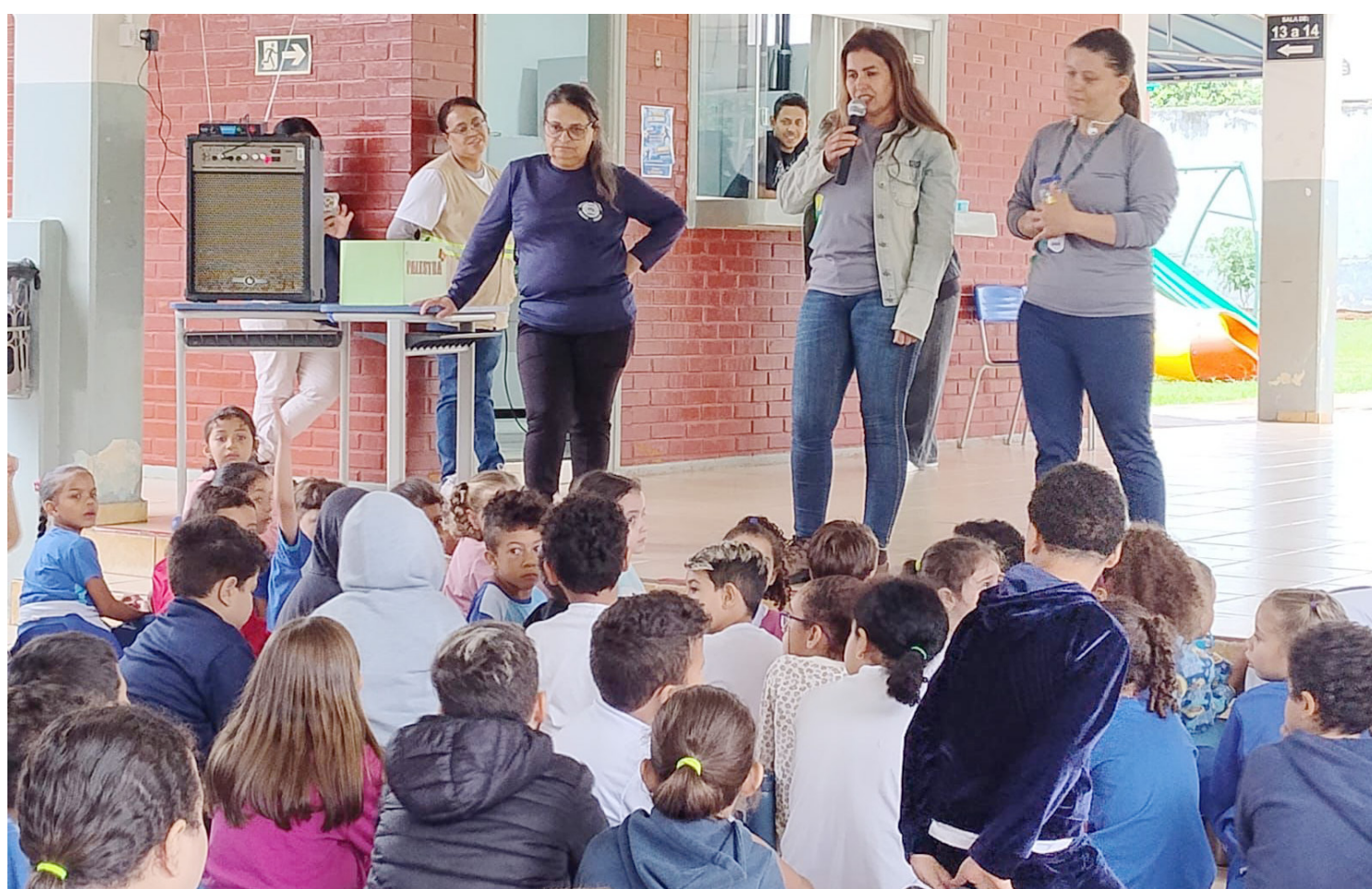
As palestras estão sendo realizadas nas escolas da rede municipal de ensino

mar multiplicadores de informação, estimulando os alunos a levarem o conhecimento adquirido para dentro de suas casas e comunidades.