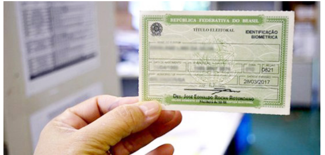
A data para fazer o título é até 6 de maio

Como o 1º turno do pleito deste ano ocorrerá em 4 de outubro, o dia 6 de maio é a data-limite para o alistamento eleitoral ou para a regularização de pendências perante a Justiça Eleitoral. Os atendi-