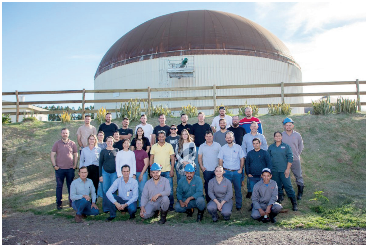
Os participantes visitaram estruturas da Cooperativa

Somente em 2025, a Usina produziu 6.813.437 kWh de energia a partir dos resíduos gerados pela Unidade de Produção de Leite e pela Unidade de Produção de Desmamados,