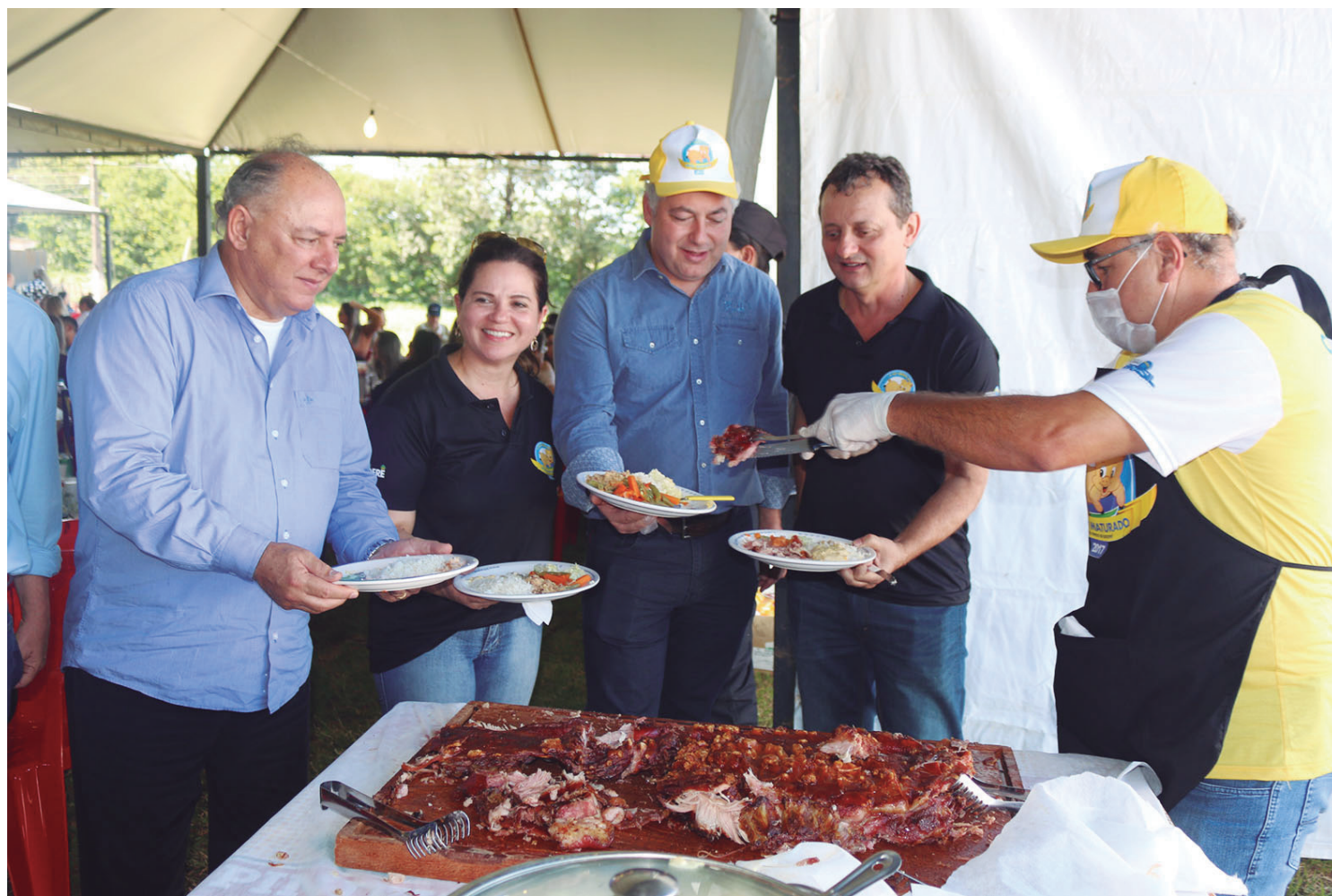
Expectativa cresce para a Festa do Leitão Maturado em Goioerê, que acontece no dia 14 de junho com grandes atrações

A entrega dos convites para venda aconteceu no sábado passado e durante a reunião, o prefeito Pedro Coelho destacou a importância da festa e aproveitou para anunciar que o evento contará com três shows musicais, sendo que a principal atração será a cantora Bruna Viola. “Estamos bastante animados e acreditando