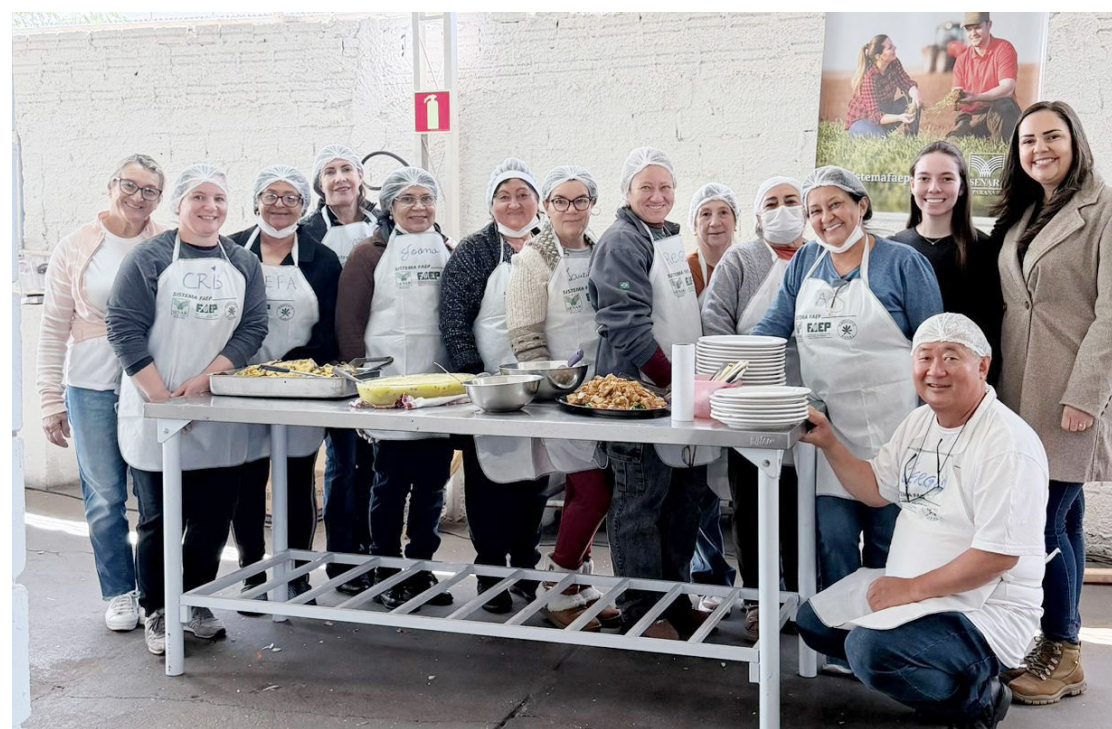
Nos dias 20 e 21 de maio foi realizado em Rancho Alegre

A iniciativa teve como objetivo incentivar a qualificação na área da culinária, além de ampliar o conheci-