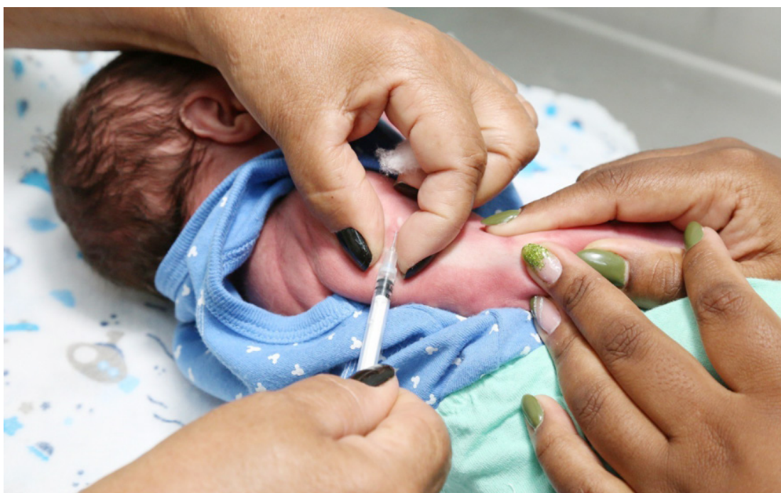
A vacina pode se encontrada na UBS Central todas as terças-feiras no período da manhã