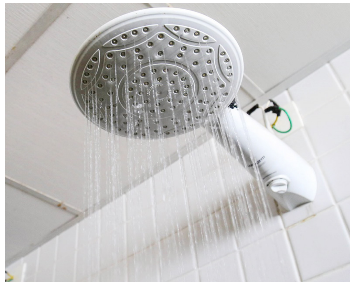
Os riscos de incêndio aumentam com a chegada do inverno

A bombeira reforça que instalações antigas podem não suportar equipamentos mais potentes, especialmente em imóveis mais antigos. Por isso, revisões periódicas da rede elétrica devem ser feitas por profissionais especiali-