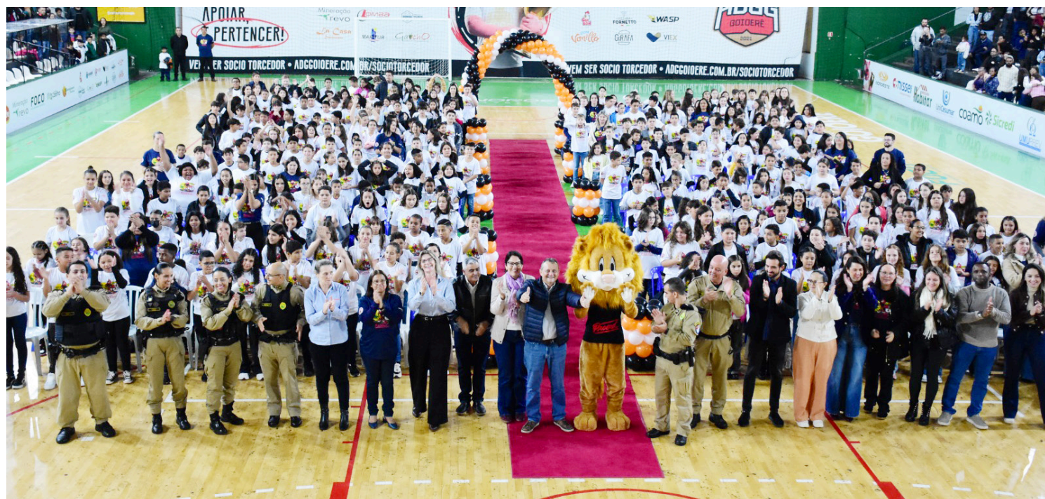
O Proerd já formou mais de 3 mil alunos em Goioerê desde 2001, fortalecendo a prevenção às drogas e à violência entre crianças e adolescentes

Desde de que foi iniciado em Goioerê, no ano de 2001, o Proerd - Programa Educacional de Resistência às Drogas e à Violência, formou 3.143 crianças até o momento. A última turma formada somou 343 alunos, cuja solenidade aconteceu quarta-feira (20) no Ginásio de Esportes.