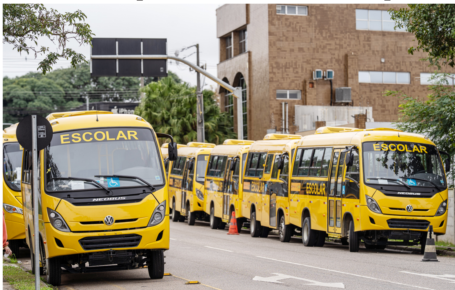
Os veículos, que representam um investimento de mais de R$ 38 milhões, fazem parte de uma aquisição de 687 ônibus que serão repassados a 340 municípios paranaenses

O Governo do Estado, por meio da Secretaria da Educação (Seed-PR), entregou nesta segunda-feira (25) 88 ônibus para o transporte escolar, que irão assegurar atendimento e transporte e garantir frequência escolar aos estudantes de 76 municípios do Estado. A solenidade aconteceu na sede da Seed-PR, em Curitiba, e contou com a presença de cerca de 150 pessoas, entre autoridades municipais e estaduais.