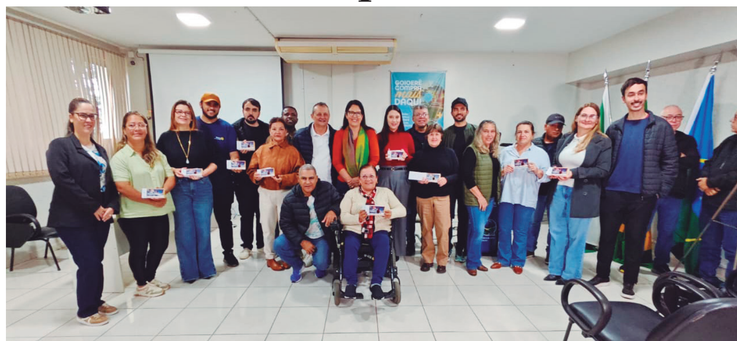
A entrega dos convites aconteceu sábado: festa será realizada no dia 14 de junho

A Prefeitura de Goioerê realizou no último sábado (16), a entrega oficial dos convites para serem comercializados pelas entidades que vão participar da Festa do Leitão Maturado 2026. No total 11 entidades estão envolvidas com o evento.