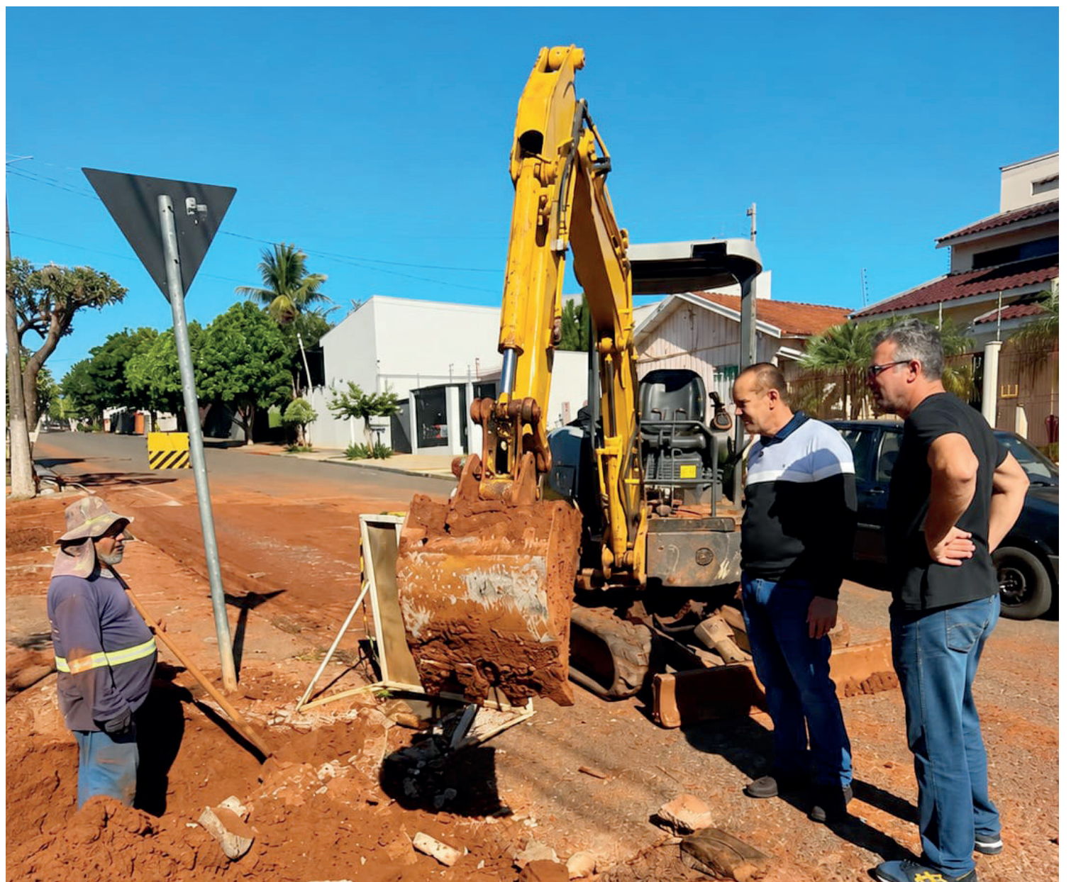
Obras da rede de esgoto avançam no bairro São José, em Moreira Sales

para o desenvolvimento das cidades, garantindo melhorias ambientais e mais dignidade para a população.