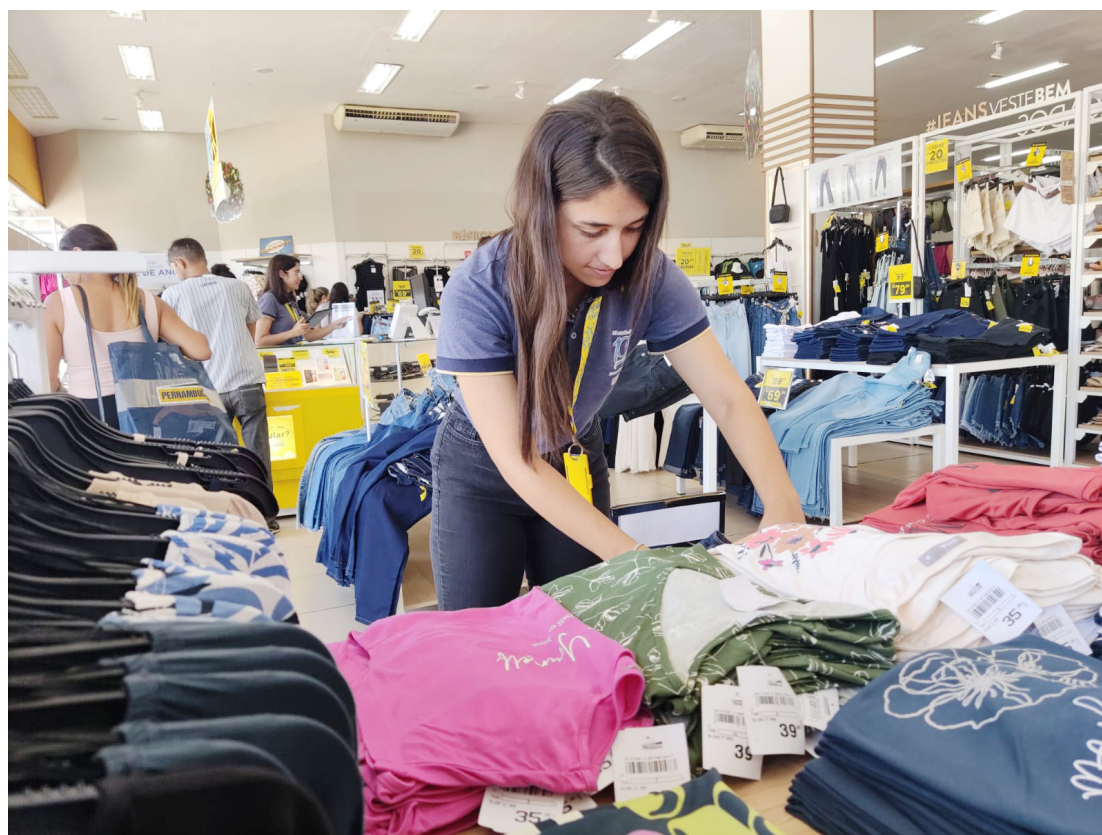
A promoção do comércio segue sendo realizada: próximo sorteio será valendo pelo Dia das Mães