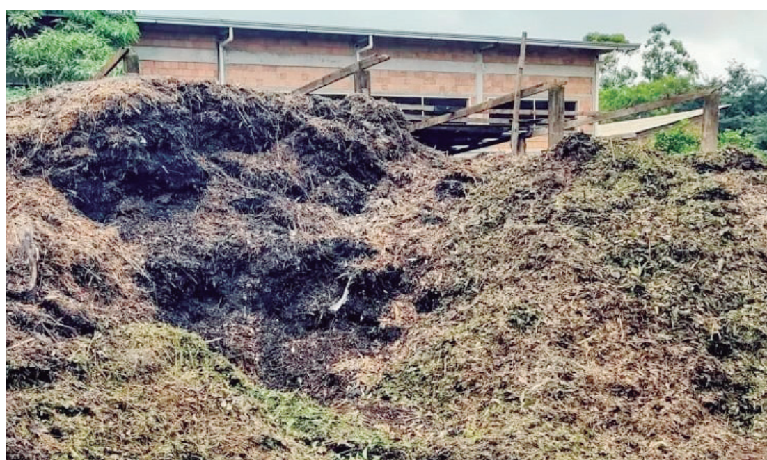
O projeto é desenvolvido através de parceria da administração municipal com o IDR

O projeto representa uma alternativa sustentável para o tratamento das galhadas recolhidas no município, contribuindo com ações ambientais e reduzindo