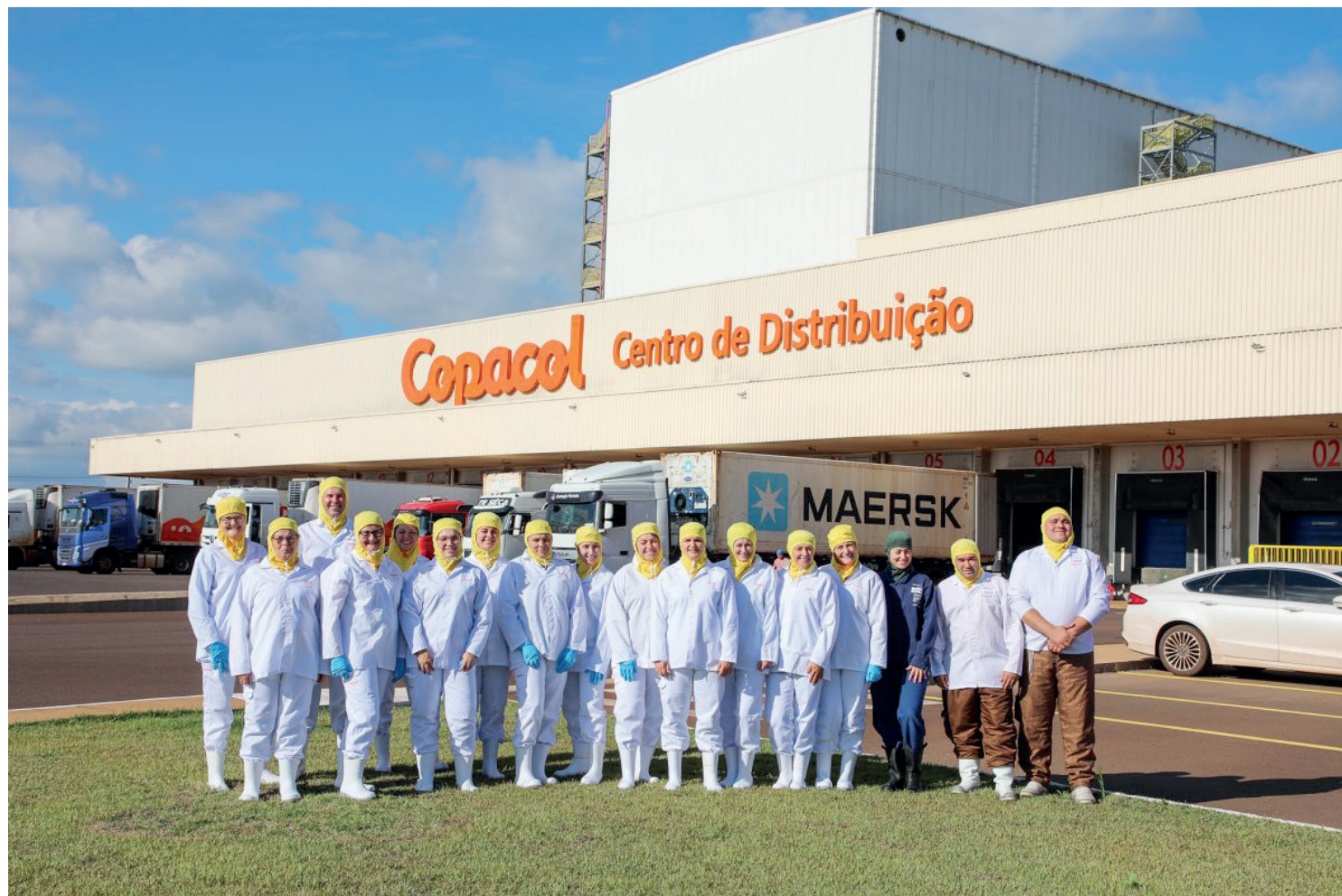
Integrantes dos Grupos Femininos que participam do Programa Gestão e Empreendedorismo Feminino, realizado pela Copacol em parceria com o SESCOOP/PR

O primeiro local visitado foi o Centro de Distribuição, localizado na comunidade Nossa Senhora da Penha, em Corbélia. A estrutura, que recentemente completou cinco anos de funcionamento, é responsável pela armazenagem e distribuição de alimentos para todo o território nacional, desempenhando papel estratégico na logística da Cooperativa. Atualmente, mais de mil cidades brasileiras são atendidas pela estrutura, reforçando a capacidade e a eficiência logística da Copacol.