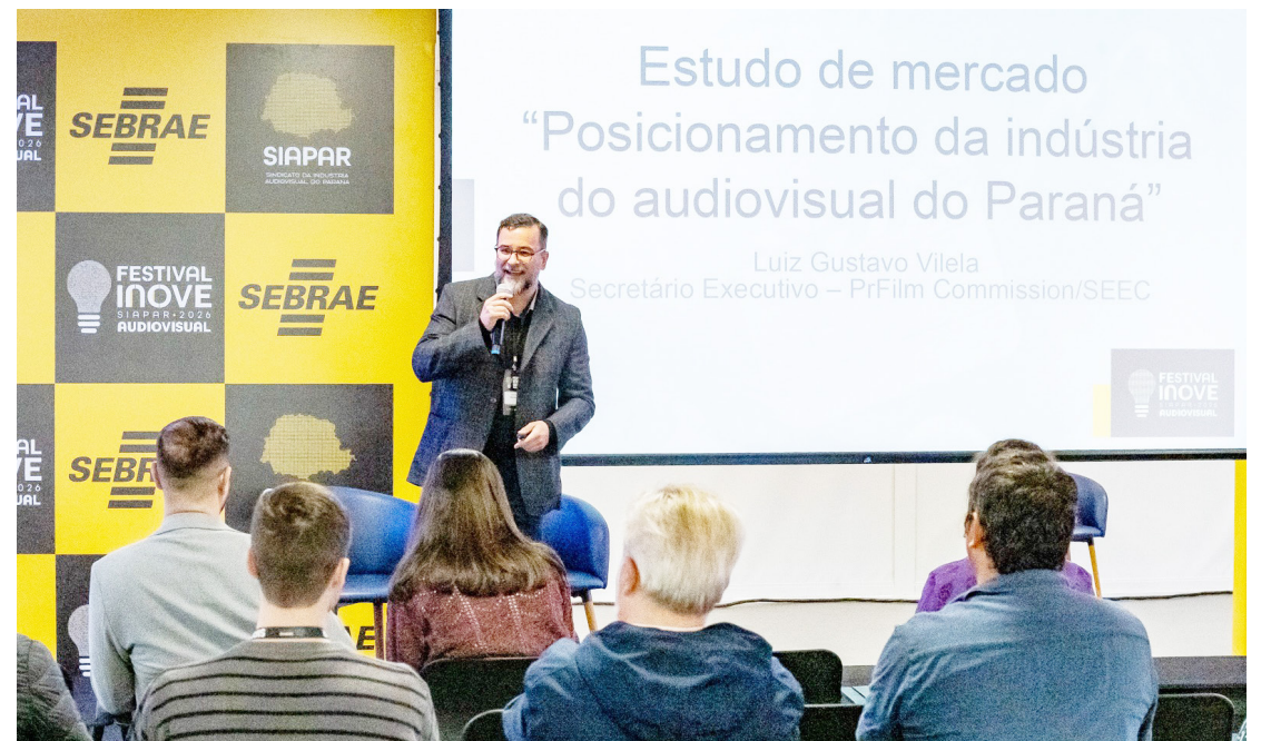
O estudo "Posicionamento da indústria do audiovisual do Paraná", uma parceria entre a secretaria estadual da Cultura e do Sebrae-PR, foi apresentado no Festival Inove Audiovisual Siapar, que acontece nesta segunda e terça-feira (4 e 5), em Curitiba.

Segundo a secretária, a disponibilização pública dos dados amplia o impacto da iniciativa. "Estamos colocando à disposição do setor informações quali-