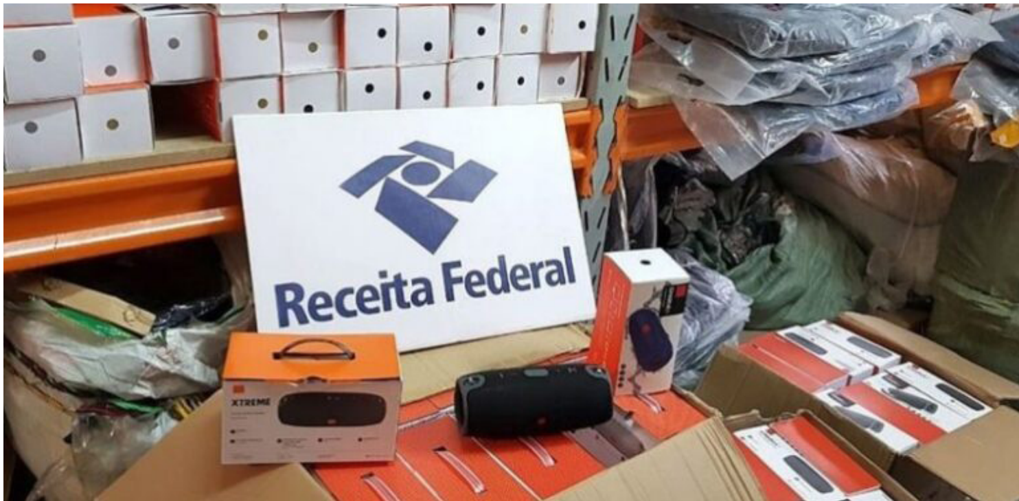
A Chácara Cristima estará realizando no próximo sábado (9), o Bazar Solidário da Receita Federal