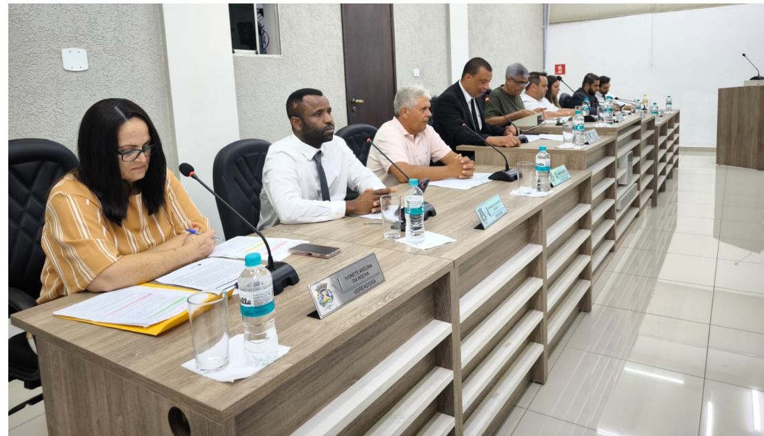
Os vereadores estiveram reunidos na noite de ontem: proposições aprovadas