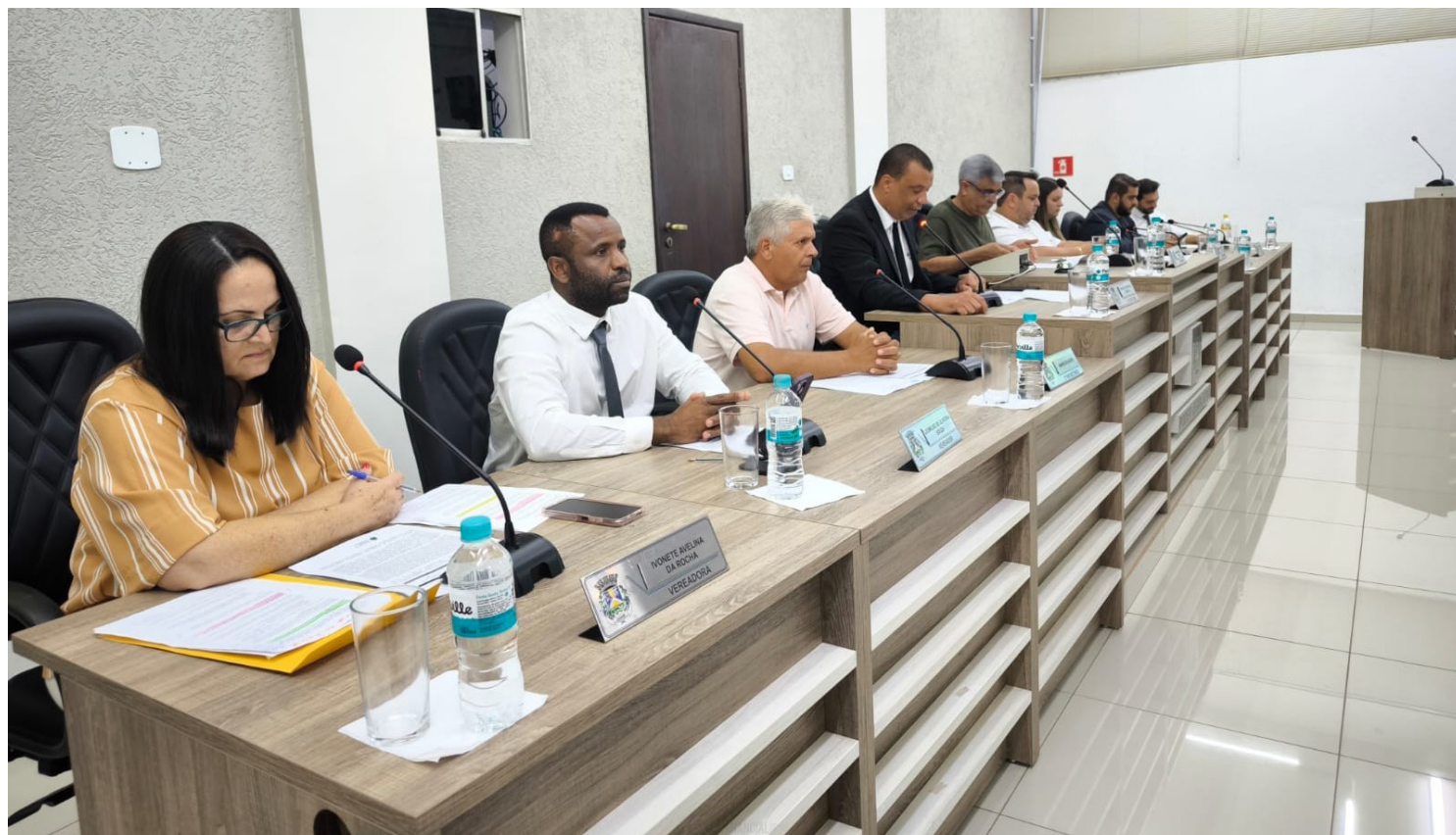
A reunião de apresentação do diagnóstico aconteceu segunda-feira (25)

tos, que está à frente da organização do evento, reforça a importância da participação da comunidade na audiência, uma vez que serão tomadas decisões para o setor cultural local.