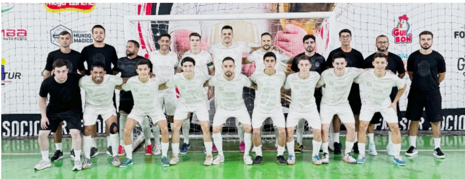
O time da ADGG que vai jogar contra o Terra Roxa neste sábado

Depois de perder para o Cianorte, jogando pela 12ª rodada do Campeonato Paranaense Série Bronze 2026, o time de futsal de Goioerê, a ADGG, busca se recuperar em partida a ser realizada em casa no próximo sábado. O jogo será contra o