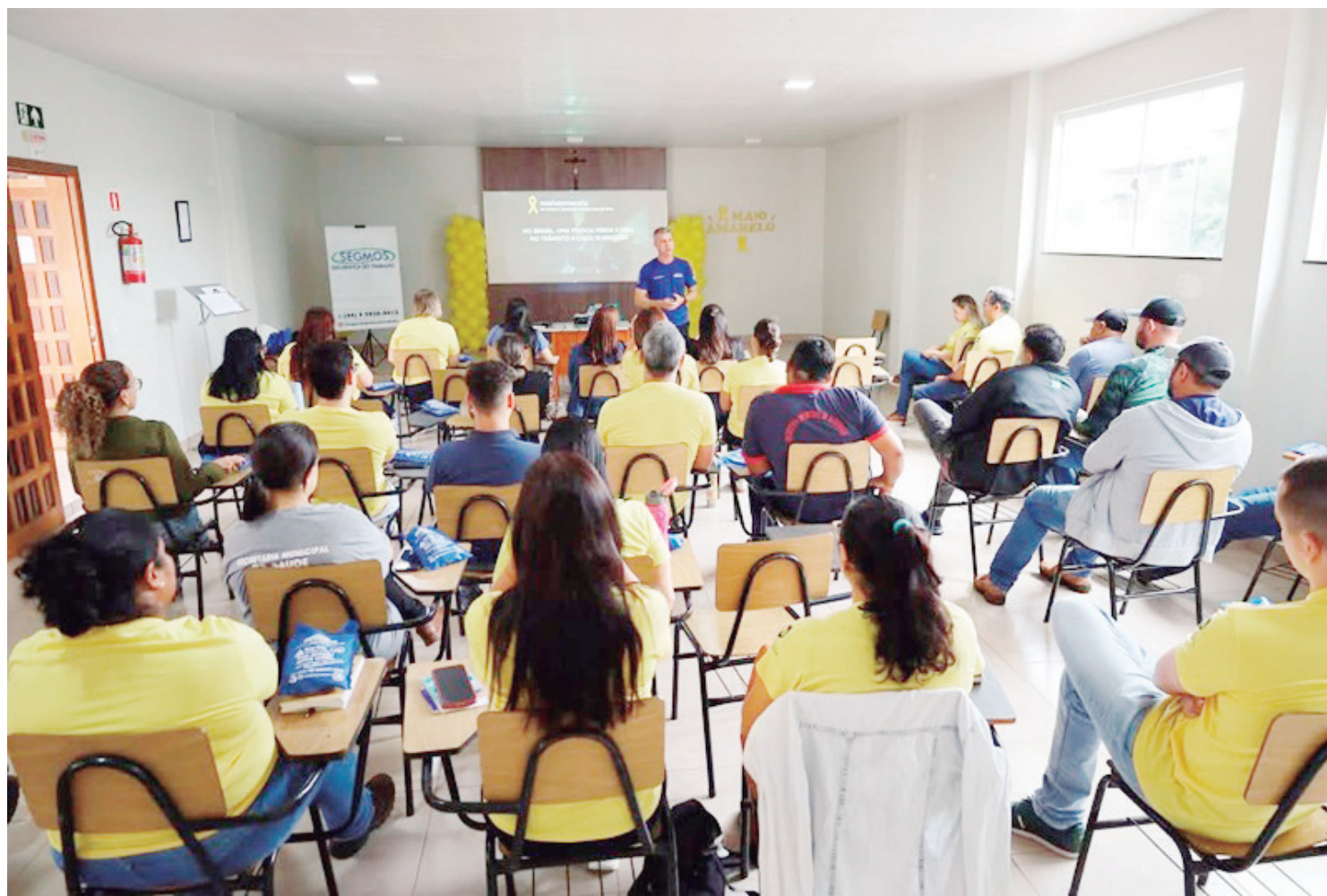
Palestras estão sendo ministradas para alertar sobre a importância da campanha

Além das orientações teóricas, a palestra também destacou a importância da postura profissional dos motoristas no dia a dia, especialmente no transporte de pacientes e estudantes, onde a responsabilidade e o cuidado devem ser redobrados. A presença expressiva