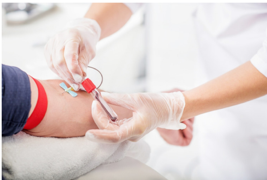
A doação será no próximo dia 19 em Campo Mourão