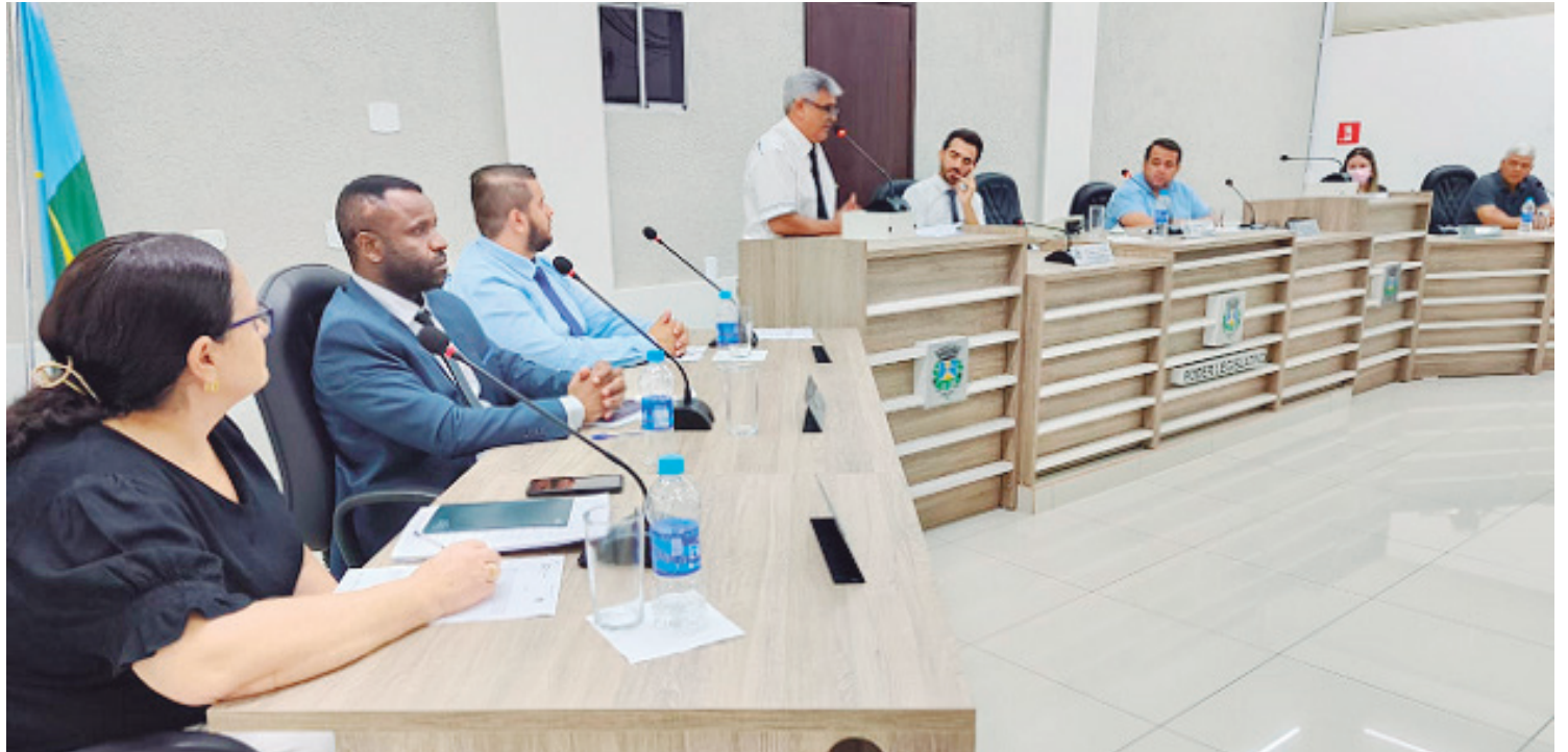
O Termo de Cooperação foi aprovado nesta semana pela Câmara Municipal

Coluna publicada simultaneamente em 22 jornais e portais associados. Saiba mais em www.adipr.com.br