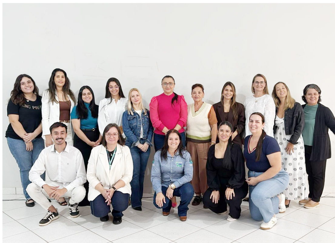
A conferência foi realizada na quinta-feira passada: conselho também foi eleito