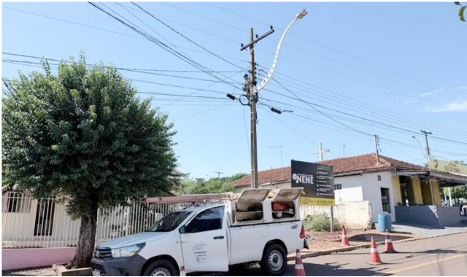
Os serviços de implantação das câmeras estão em fase final

O projeto prevê cobertura completa das vias de acesso ao município, incluindo também o monitoramento das entradas das comunidades rurais. O sistema contará com câmeras de alta resolução e tecnologia de identificação de placas de veículos,