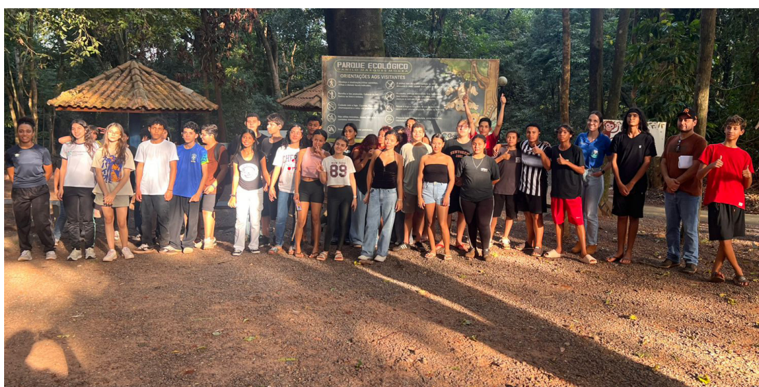
A atividade foi feita na tarde da última quinta-feira (7)

conhecimento dos alunos e fortalecer a consciência ambiental entre os jovens,