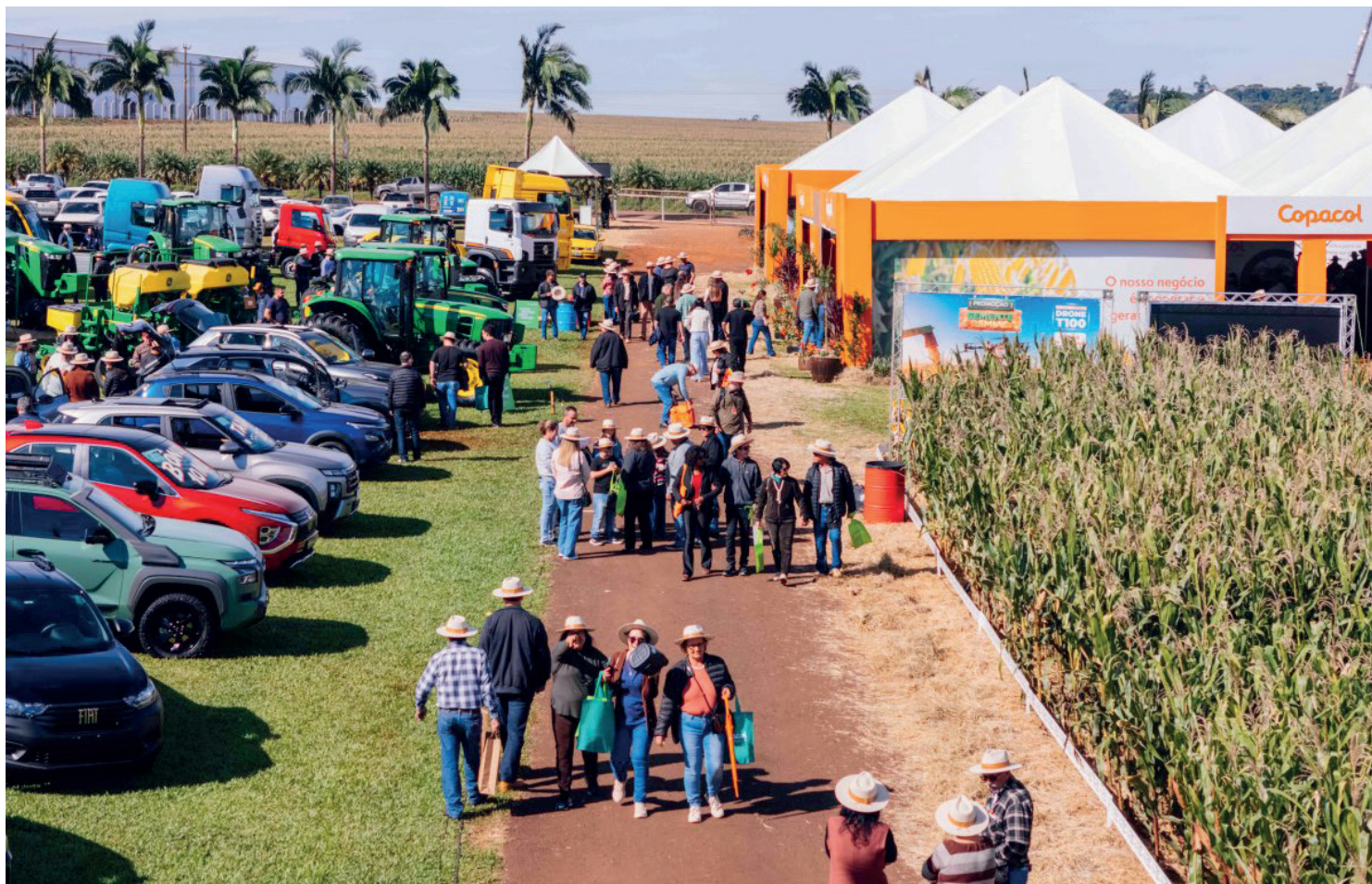
O Copacol Agro segue nesta quinta-feira, 14, em Cafelândia

O palestrante citou como exemplo positivo a guerra comercial entre Estados