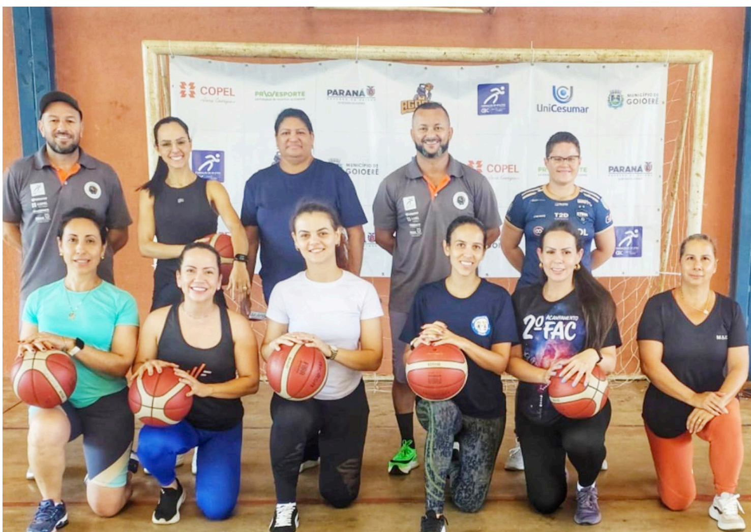
O treinamento envolveu diversos professores da rede municipal de ensino

Durante a capacitação, os educadores receberam orientações sobre métodos modernos de ensino do basquete, além de estratégias para tornar as aulas mais dinâmicas, eficientes e alinhadas ao desenvol-