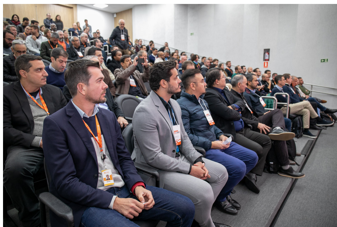
Fórum Copel Agro