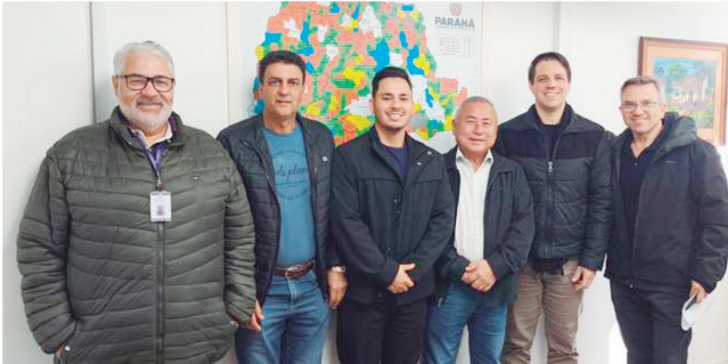
O convênio foi assinado nesta terça-feira na capital do estado

Segundo o prefeito, o projeto tem como principal objetivo atender famílias em situação de maior vulnerabilidade social, contribuindo