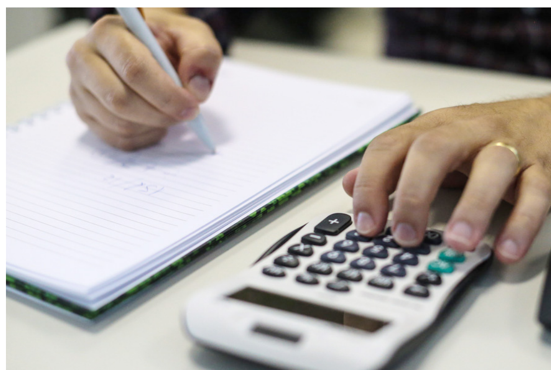
Os contribuintes têm até o próximo dia 29 para participarem do processo

É permitida a destinação de até seis por cento do imposto devido (três para o FMDCA e três por cento para o FMI) para ajudar no custeio de projetos sociais. Em Goioerê, milhares de pessoas físicas estão aptas a fazer doação na campanha IR Solidário.