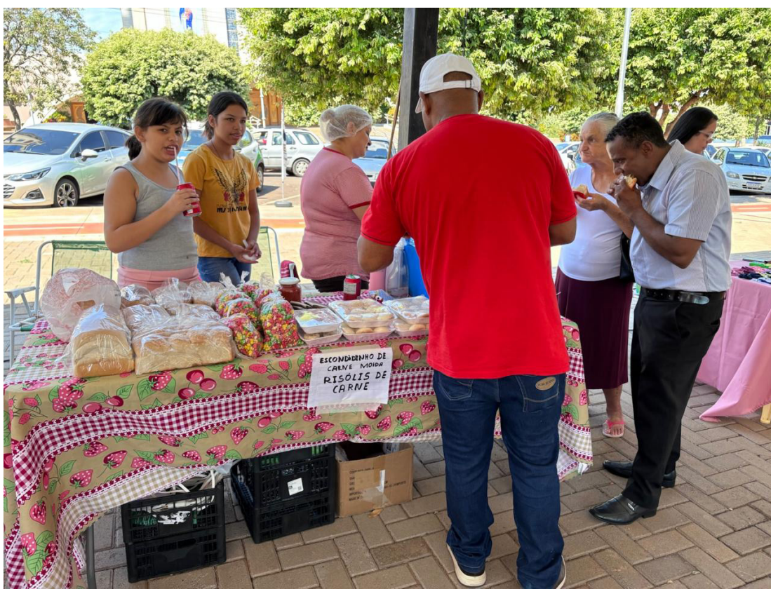
O evento está programado para acontecer neste sábado, dia 16

A exemplo de edições passadas, a feira reunirá empreendedores de diferentes segmentos, oferecendo ao público uma grande variedade