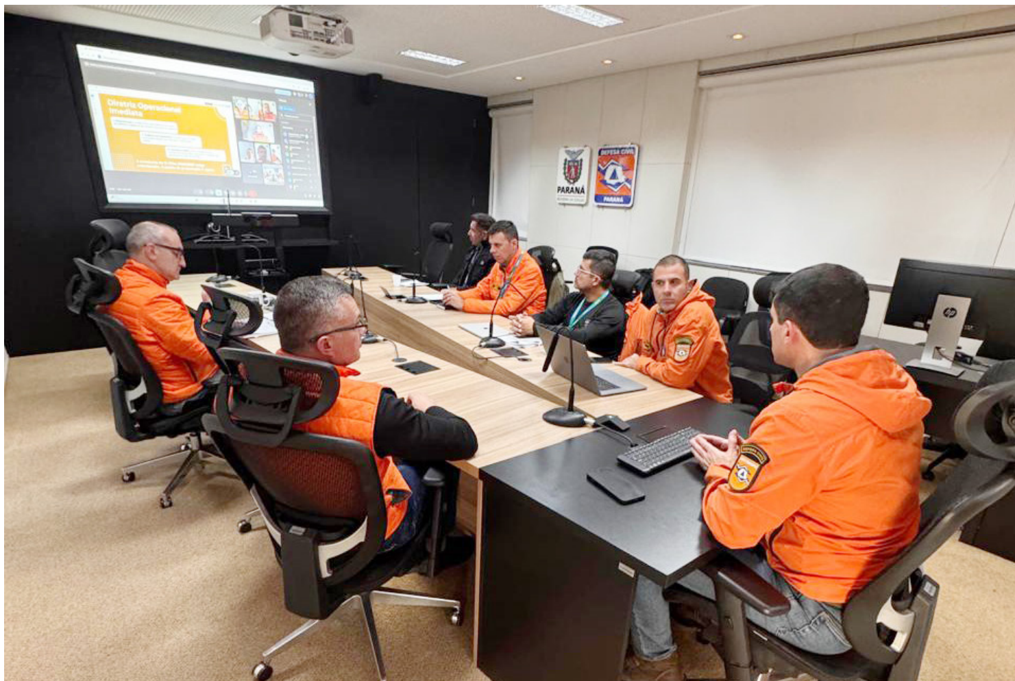
Simepar acompanha impacto do fenômeno climático e Defesa Civil também atua na orientação das prefeituras, com ações preventivas, treinamentos e simulações, além da disponibilidade de recursos.

No padrão internacional, a sigla ENOS refere-se à oscilação entre o aquecimento (El Niño) e esfriamento (La Niña) das águas do Pacífico Equatorial. De acordo com o Climate Prediction Center da NOAA (Administração Nacional Oceânica e Atmosférica, agência federal americana), o ENOS é um dos fenômenos climáticos mais importantes da Terra devido à sua capacidade de