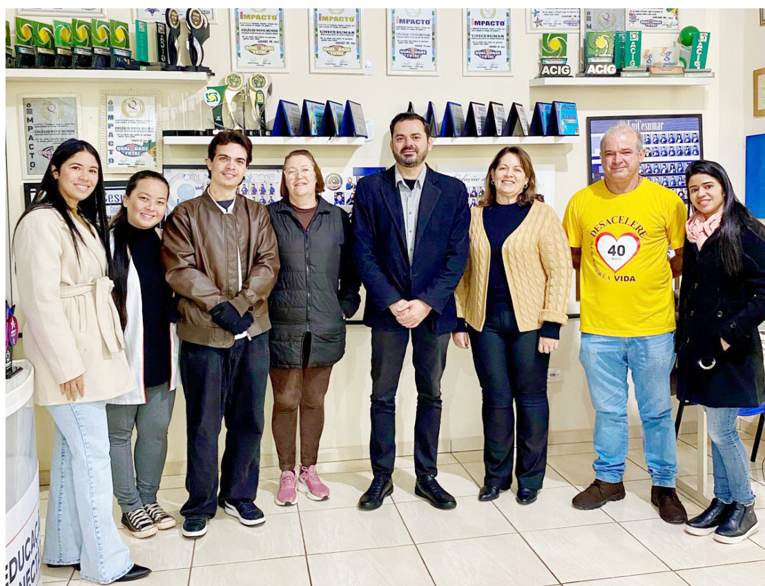
a campanha já ultrapassou mil interações por meio de uma dinâmica criativa e educativa

Logo nos primeiros dias, a campanha já ultrapassou mil interações por meio de uma dinâmica criativa e educativa promovida pela Secretaria de Segurança Pública e Trânsito. A iniciativa vem envolvendo estudantes da rede de ensino, empresas e o comércio local, reforçando a importância da responsabilidade