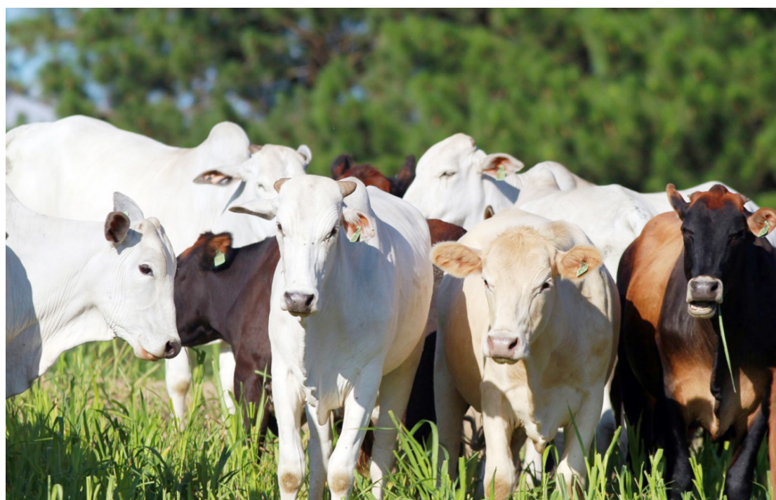
A atualização cadastral é obrigatória e deverá ser realizada entre os dias 1º de maio e 30 de junho

Segundo a Secretaria de Agricultura, a atualização é fundamental para manter o controle sanitário do rebanho paranaense, contribuindo diretamente para a prevenção de doenças, rastreabilidade animal e fortalecimento da agro-