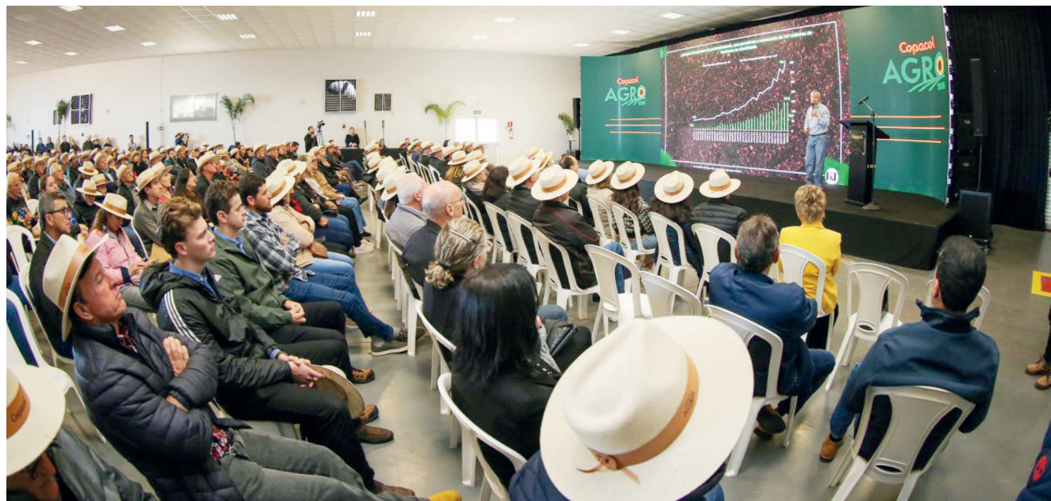
O primeiro dia do Copacol Agro 2026 foi marcado pela troca de conhecimento, exposição de inovações tecnológicas para o campo e o fortalecimento do agronegócio

A família cooperada compareceu ao Copacol Agro conhecendo cada atração. Com 90 expositores, a feira apresenta novidades voltadas à agricultura, avicultura, piscicultura, suinocultura e bovinocultura de leite, além de condições especiais em insumos, equipamentos e implementos agrícolas. Os visitantes também acompanharam demonstrações técnicas no campo experimental do CPA, que conta com 84 hectares dedicados à avaliação de híbridos de milho, defensivos