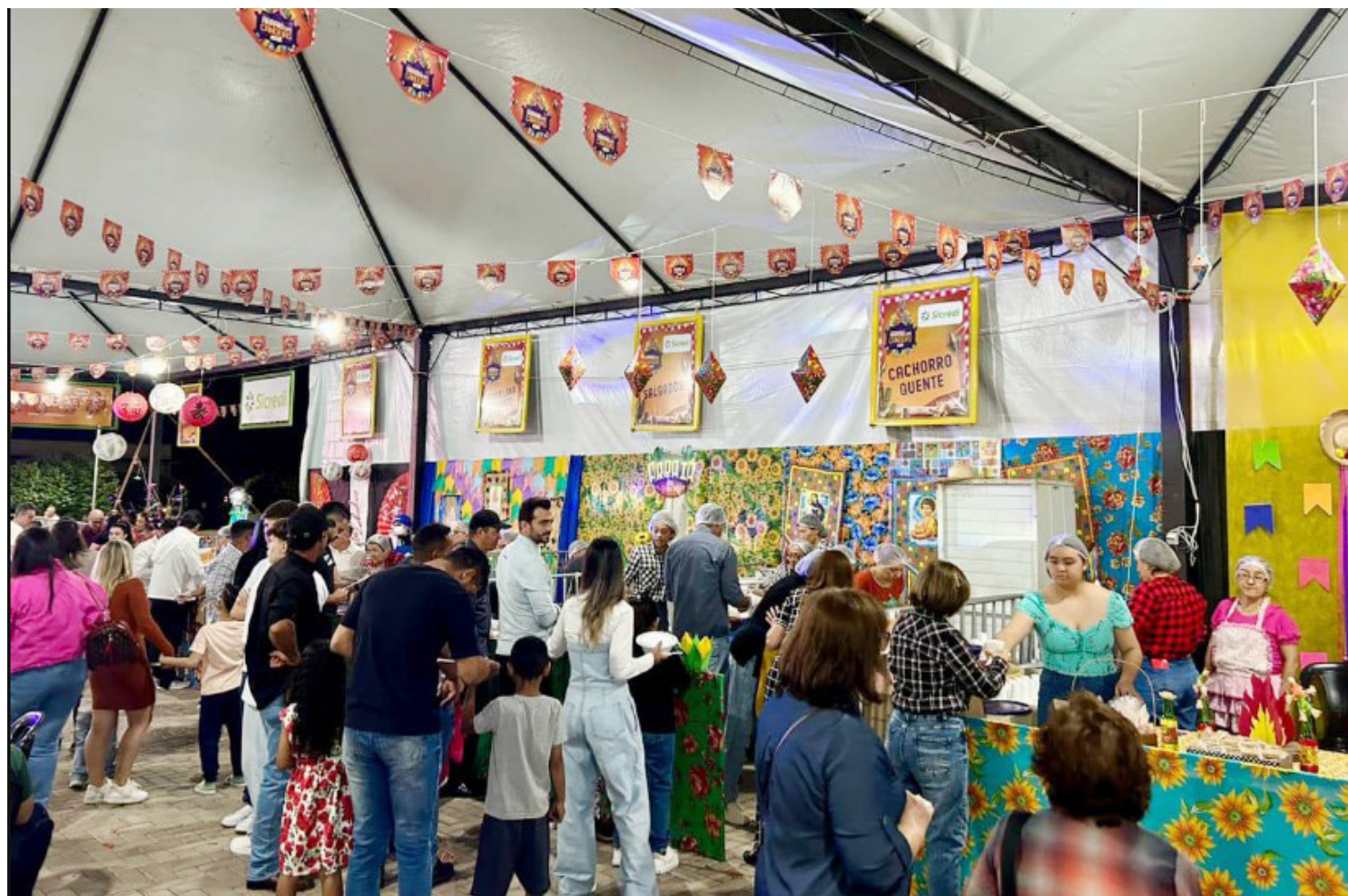
O arraiá será realizado nos dias 23 e 24 de maio, contando com variados tipos de comidas típicas, show de prêmios e muita animação

De acordo com os organizadores, a expectativa do evento é das melhores, com a festa reunindo moradores da cidade, bem como gente de municípios vizinhos e até de localidades mais distantes. “Nossa festa é tradicional e por isso estamos com