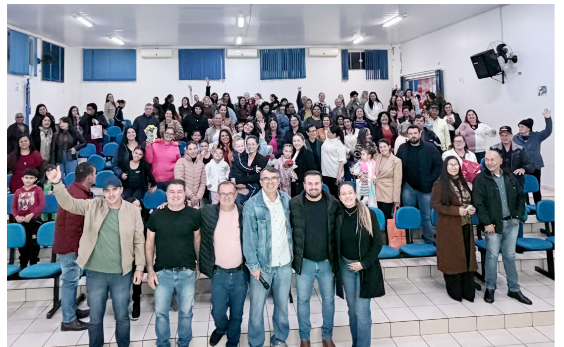
O evento reuniu famílias, autoridades e a comunidade em um momento marcado por emoção

A Casa da Cultura de Rancho Alegre D'Oeste realizou, na noite de ontem, uma apresentação especial em homenagem