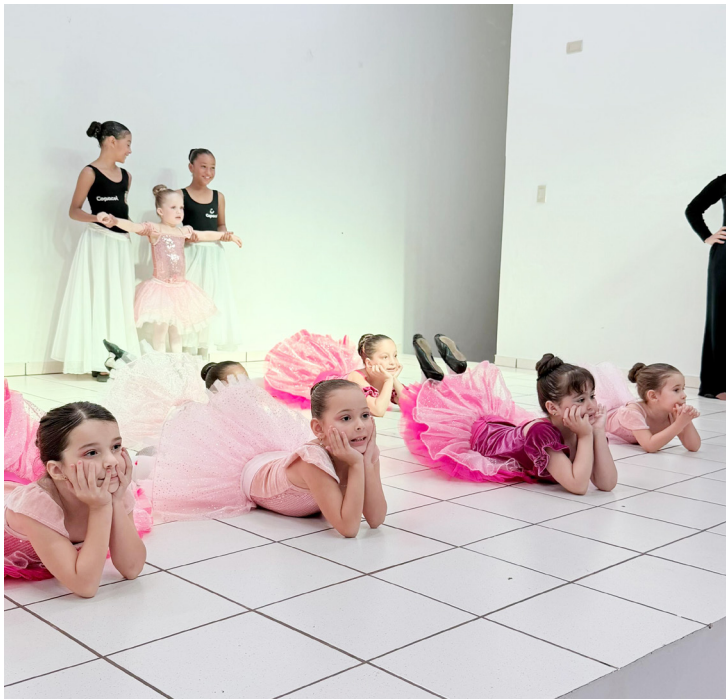
A programação contou com apresentações artísticas preparadas pela Casa da Cultura

A programação contou com apresentações artísticas preparadas pela Casa da Cultura, proporcionando uma noite de homenagens e valorização das mães rancho-alegrenses.