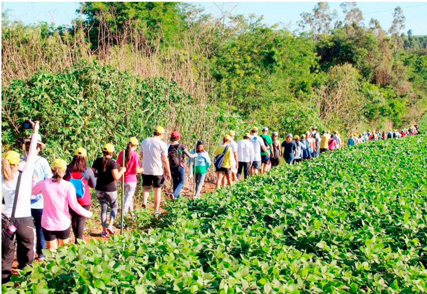
A nova data será ser anunciada nos próximos dias

Segundo os organizadores, a decisão foi tomada visando garantir a segurança, o bem-estar e o conforto dos caminhantes, já que o volume de chuva previsto poderia comprometer partes do trajeto, causando riscos aos participantes e