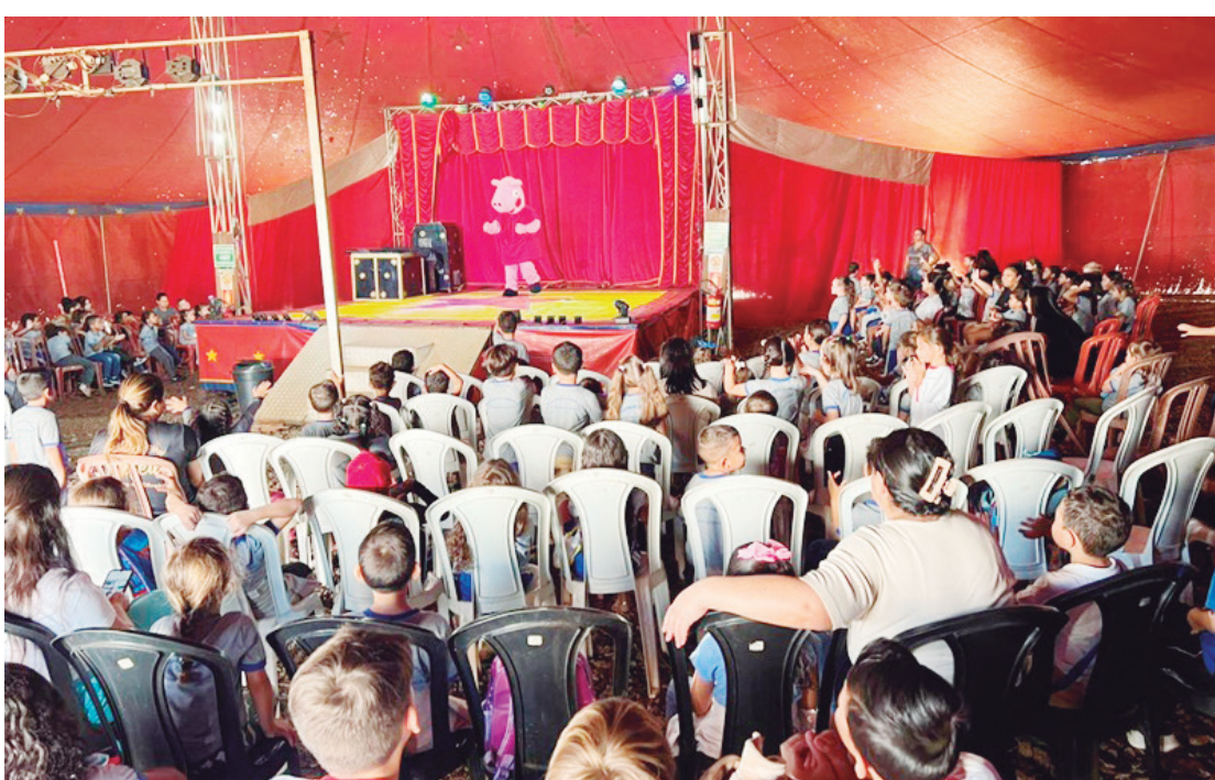
As crianças participaram ativamente do espetáculo em Janiópolis

O circo faz suas últimas apresentações em Janiópolis neste final de semana, com ingressos disponíveis ao valor de R$ 10,00 para o público em geral. Para a maioria das crianças foi a primeira vez num circo tradicional.