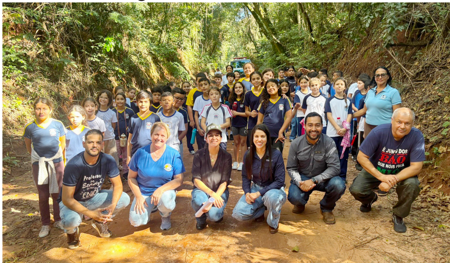
A ação reuniu alunos do 4º e 5º ano do ensino fundamental em uma caminhada ecológica