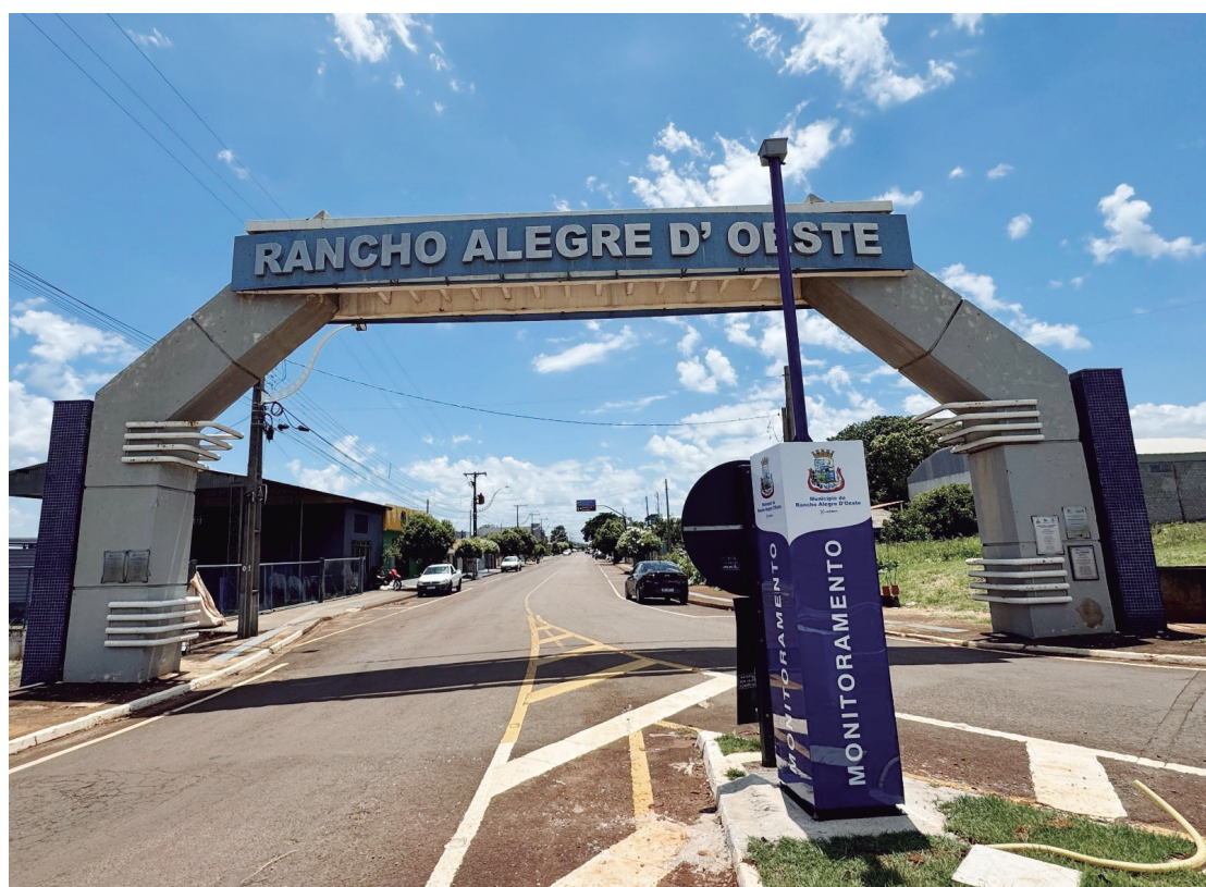
Os contribuintes agora terão até o dia 15 de julho para efetuar o pagamento

A administração municipal orienta que os moradores fiquem atentos à nova data de vencimento para evitar transtornos e manter suas obrigações tributárias em dia. Os recursos arrecadados por meio do IPTU são destinados a investimentos e à manutenção de serviços essenciais, como saúde, educação, infraestrutura urbana, limpeza pública e outras ações que beneficiam diretamente a população.