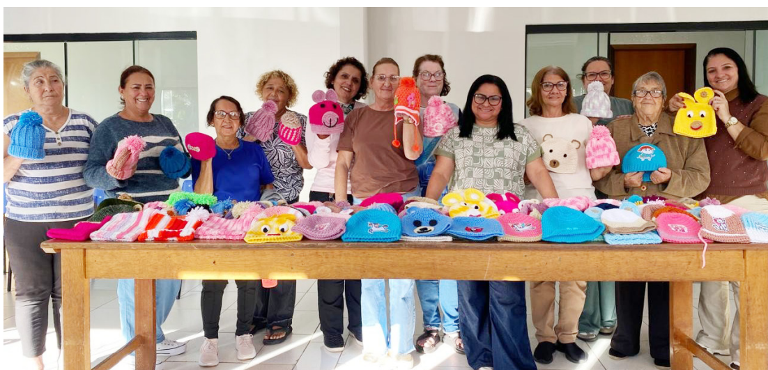
Toucas são para crianças em tratamento contra o câncer: solidariedade não tem idade

Mais do que um trabalho manual, o projeto mobilizou sentimentos de solidariedade, empatia e amor ao próximo. As idosas dedicaram horas de trabalho voluntário para transformar novelos de lã em símbolos de acolhimento para crianças que, muitas vezes, enfrentam o tratamento longe de casa e