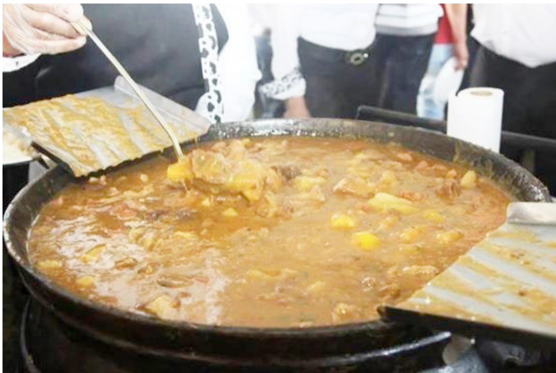
O prato típico do município no próximo dia 26 de julho: convites à venda a partir desta quarta-feira

A Festa da Vaca Atolada é um dos eventos mais