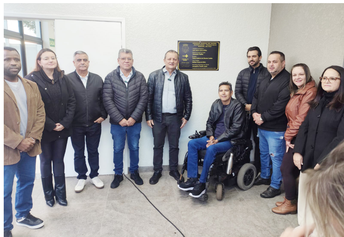
A solenidade contou com a presença de várias autoridades, como vereadores e secretários municipais

ursos havia expirado, mas com muito esforço conseguimos resgatar os valores e hoje estamos aqui entregando essa grande obra”, citou.