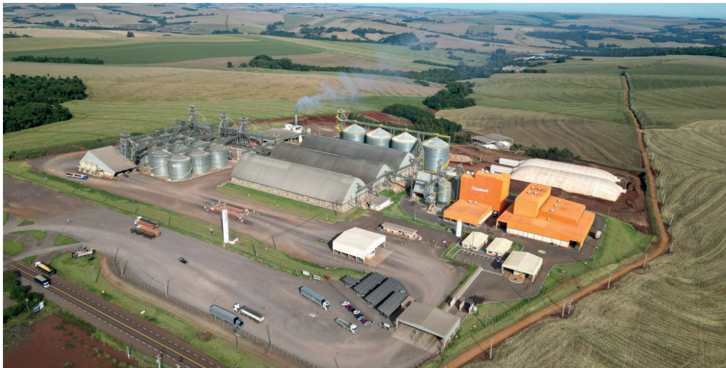
Ao todo, a Cooperativa investiu R$ 1,6 bilhão nos últimos seis anos na modernização das instalações proporcionando agilidade e melhor fluxo para a entrega de soja e milho

Infraestrutura avançada para recebimento e classificação de grãos garante à Copacol ampla capacidade para a estocagem em cada safra no Oeste e Sudoeste do Paraná. Ao todo, a Cooperativa investiu R$ 1,6 bilhão nos últimos seis anos na modernização das instalações proporcionando agilidade e melhor fluxo para a entrega de soja e milho. O balaço esteve em evidência em mais um ciclo de reuniões dos Comitês Educativos realizadas em Formosa do Oeste, Jesuítas, Nova Aurora e Cafelândia. “Estamos instalados em uma área de atuação formada por um milhão de hectare e temos muitos projetos em andamento para avançarmos, tanto no desempenho produtivo das lavouras, quanto na estocagem dos grãos. Esse investimento realizado ao decorrer dos anos reflete em segurança a cada safra para o recebimento das safras. Tivemos um crescimento significativo em produtividade, o que é fundamental para a produção de ração que mantém as nossas integrações”, explica o diretor-presidente da Copacol, Valter Pitol.