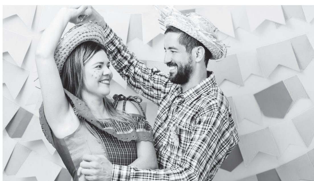
O Happy Hour Junino - Arraiá dos Sócios está agenda pra acontecer no próximo dia 30

No total serão sorteados três vale-compras de R$ 500,00 cada e um jantar romântico para duas pessoas, que será