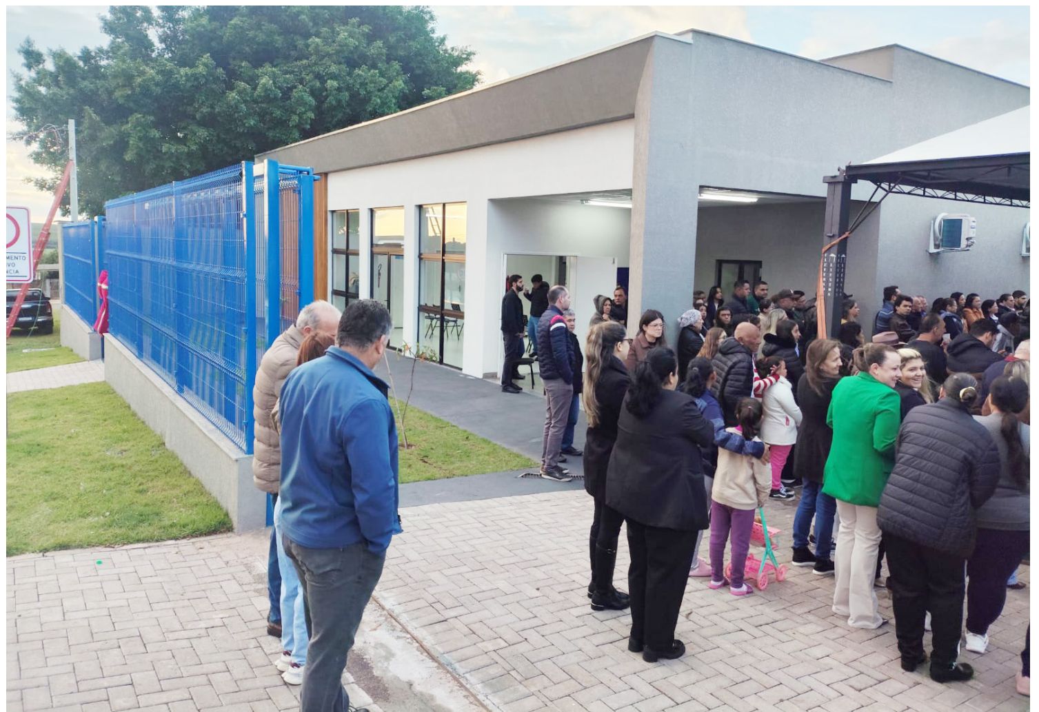
A inauguração aconteceu na manhã desta segunda-feira em Jaracatiá

Durante sua fala, o prefeito lembrou a saga para resgatar os recursos para a construção da UBS. “Quando assumimos a prefeitura, ainda no período da transição, percebemos que o prazo para a garantia dos re-