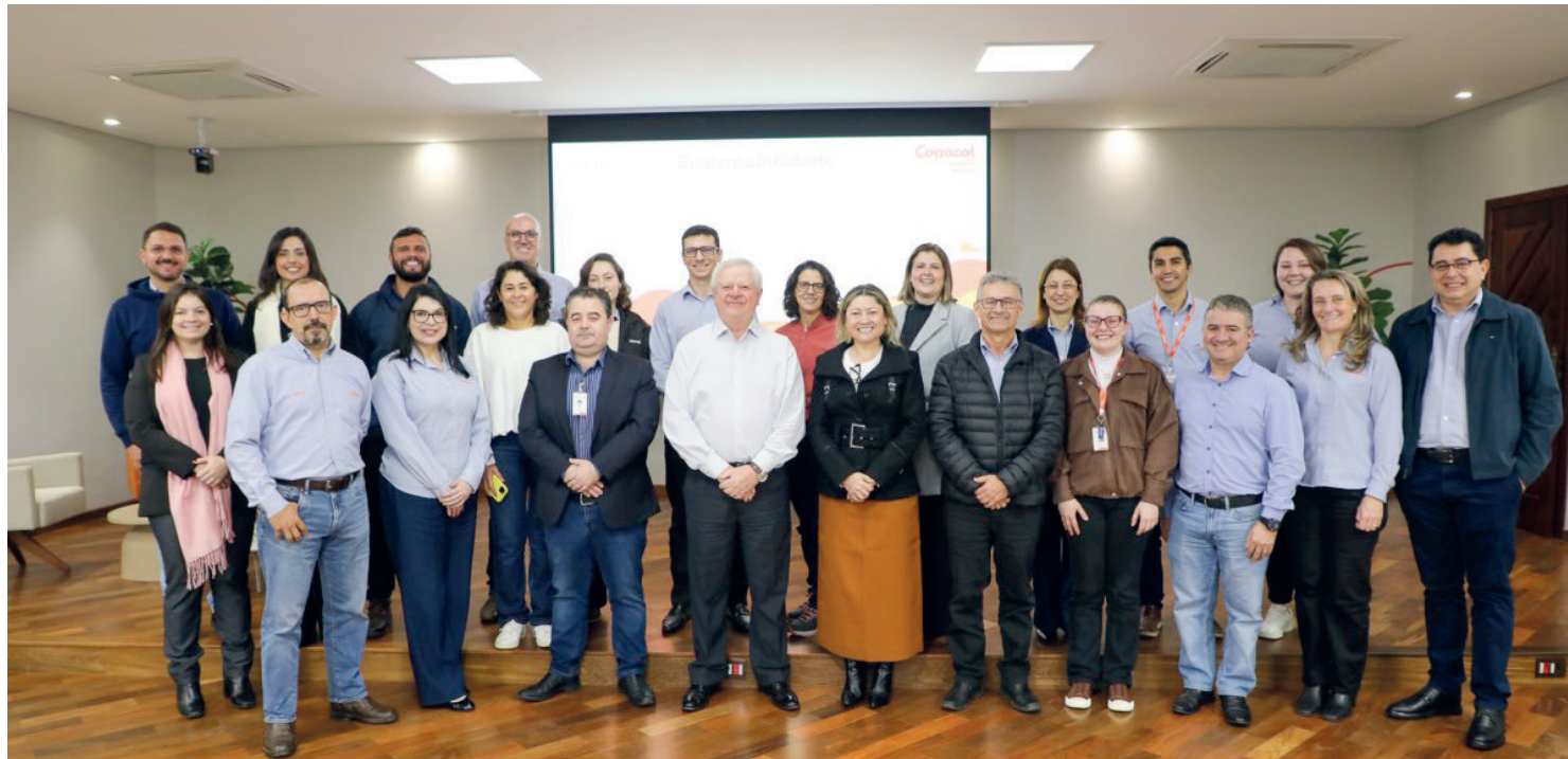
A publicação contempla um panorama integral das atividades da primeira Cooperativa do Oeste do Paraná, os seus impactos e como eles são minimizados a curto e longo prazos

dos, 16,8 mil colaboradores, 10,5 mil clientes nos mercados interno e externo, 6 mil fornecedores, o faturamento anual da Cooperativa é de R$ 11,1 bilhões, totalizando 479,6 milhões de dólares em exportações, R$ 453 milhões revertidos em ações à comunidade por meio de impostos e pagamento de R$ 224,9 milhões em obras e complementações: desempenho privilegiado que põe a Copacol entre as maiores do setor no Brasil. Desta forma, para que toda a complexa movimentação esteja documentada, o Relatório de Sustentabilidade da Copacol