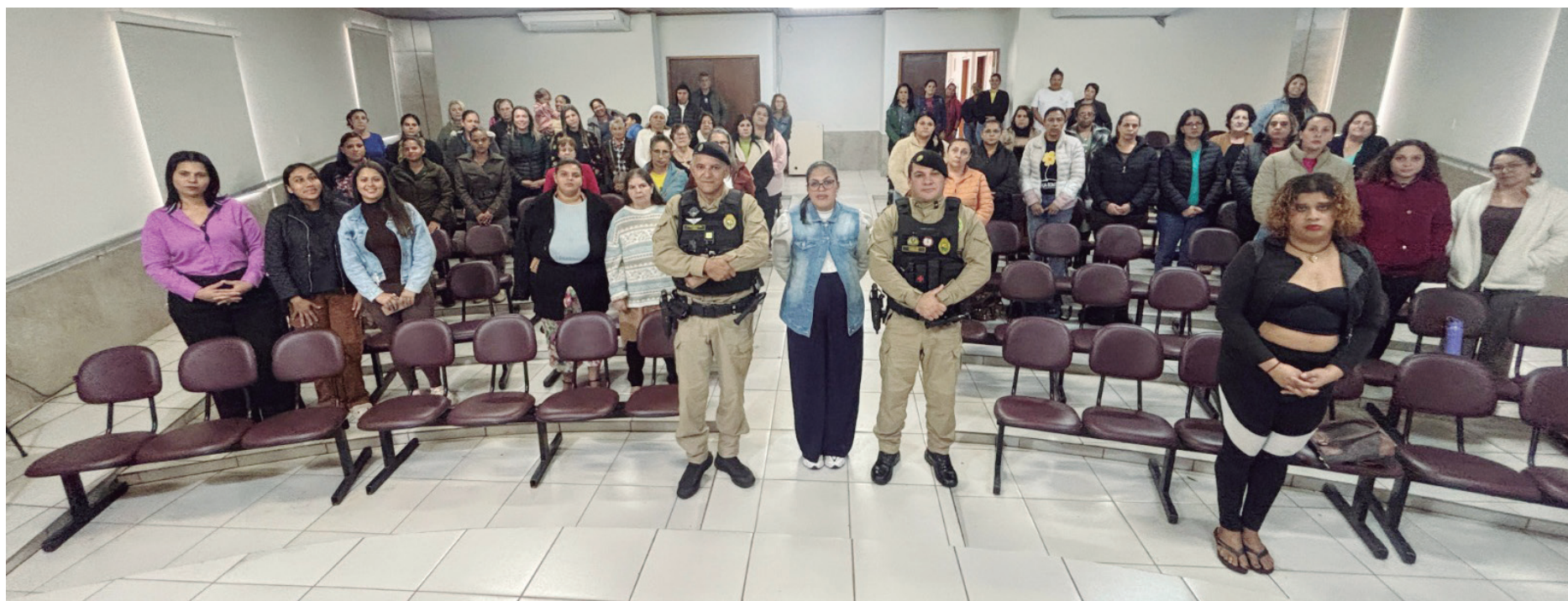
A palestra foi realizada na última sexta sobre o enfrentamento à violência contra a mulher

Durante o encontro, foram abordados temas relacionados aos direitos das mulheres, aos canais de denúncia disponíveis e às formas de buscar apoio e proteção em situações de violência. A iniciativa teve como principal objetivo ampliar o acesso à infor-