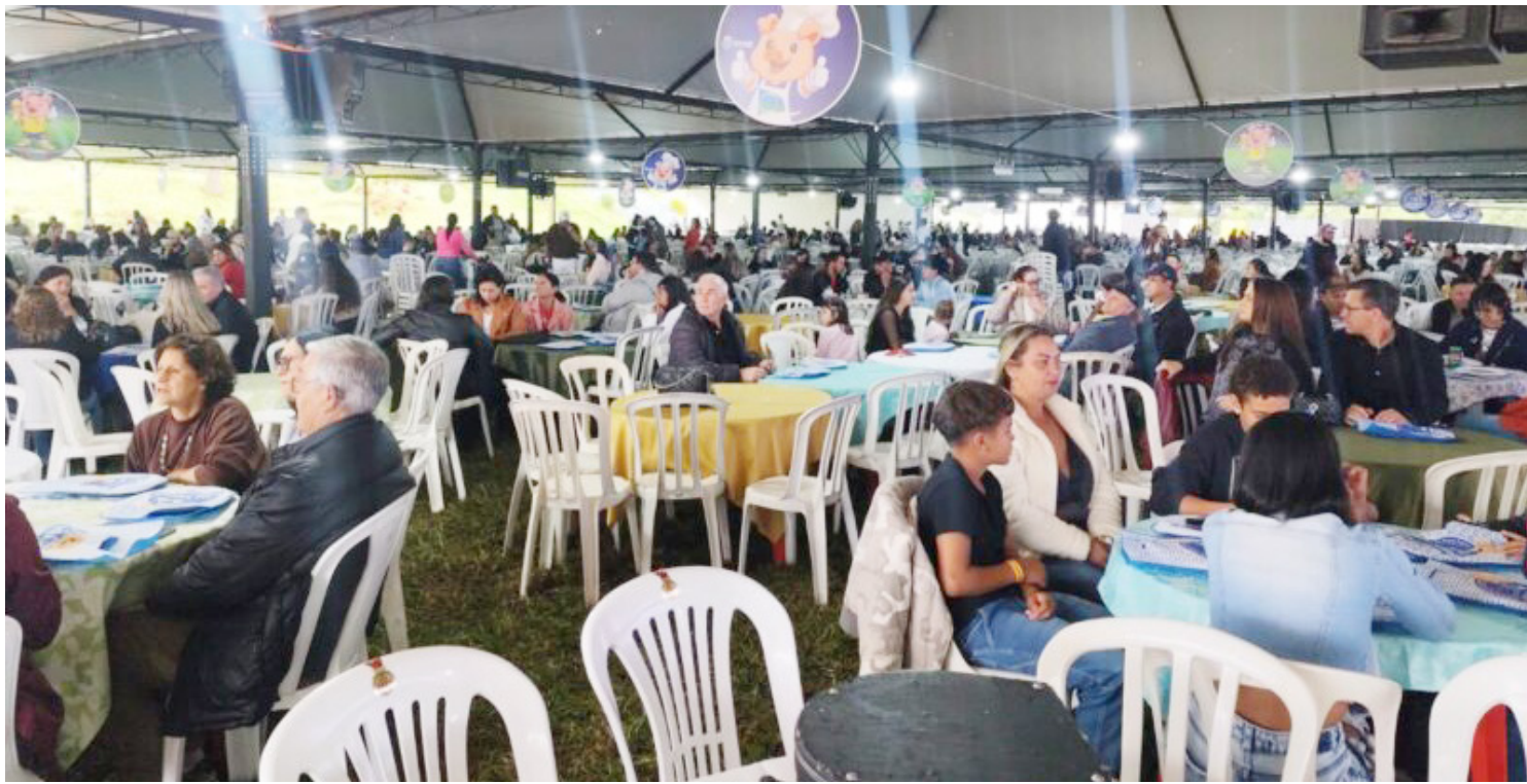
No total cerca de 4 mil pessoas participaram da festa realizada no último domingo em Goioerê

A programação teve início ainda durante o almoço, com