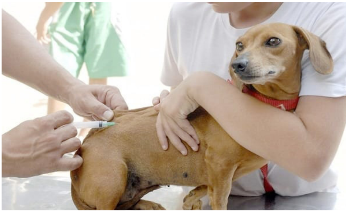
As vacinações vão acontecer neste sábado em Goioerê

A vacinação será realizada a partir das 9 horas, na Avenida Daniel Portela, no