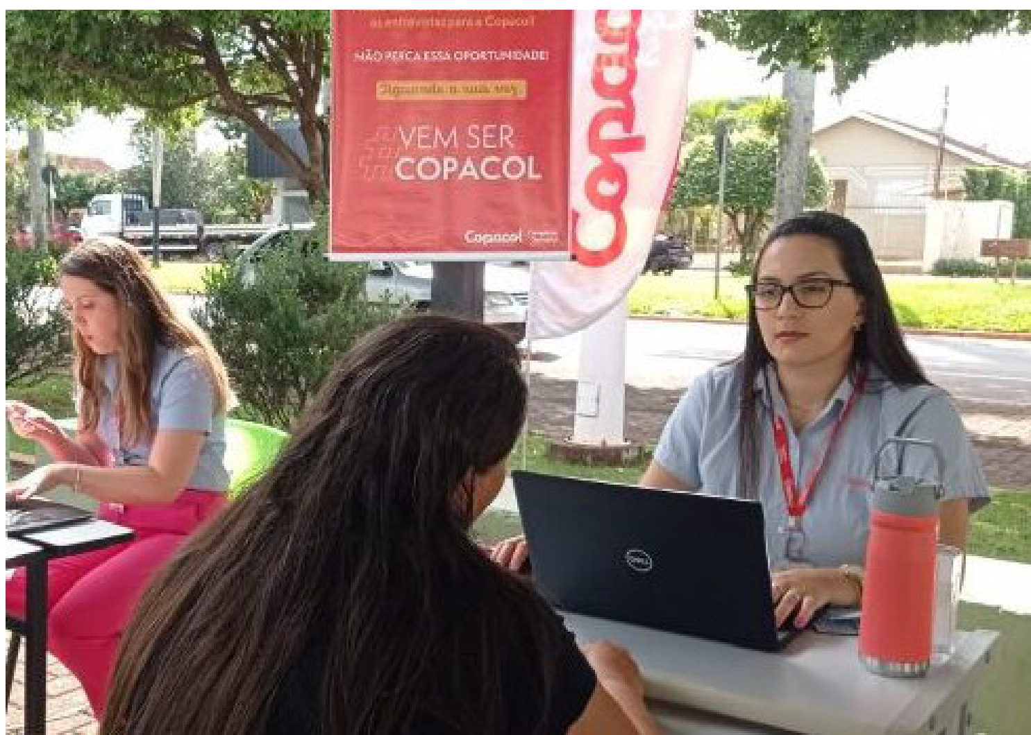
As entrevista acontecerão nesta quinta-feira, na agência do trabalhador

Uma das vagas é para Auxiliar Operacional na Recolha de Aves, com remuneração de até R$ 3.583,84, composta por salário-base, prêmio variável e vale-alimentação. A