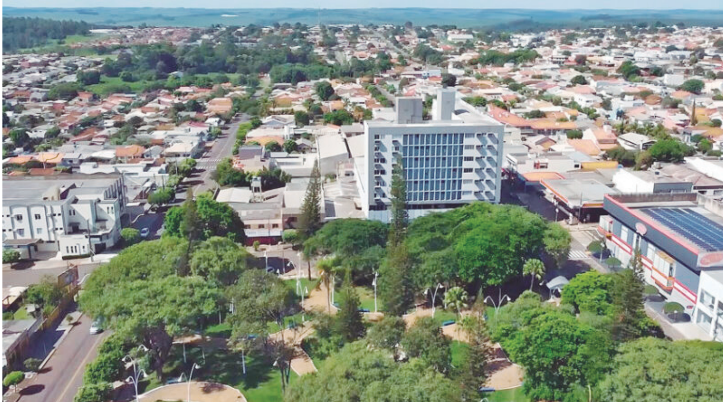
Os interessados tem até o próximo dia 13 de Julho para realizarem as inscrições

Conforme o edital, há também oportunidades para auditor fiscal, contador, engenheiros,