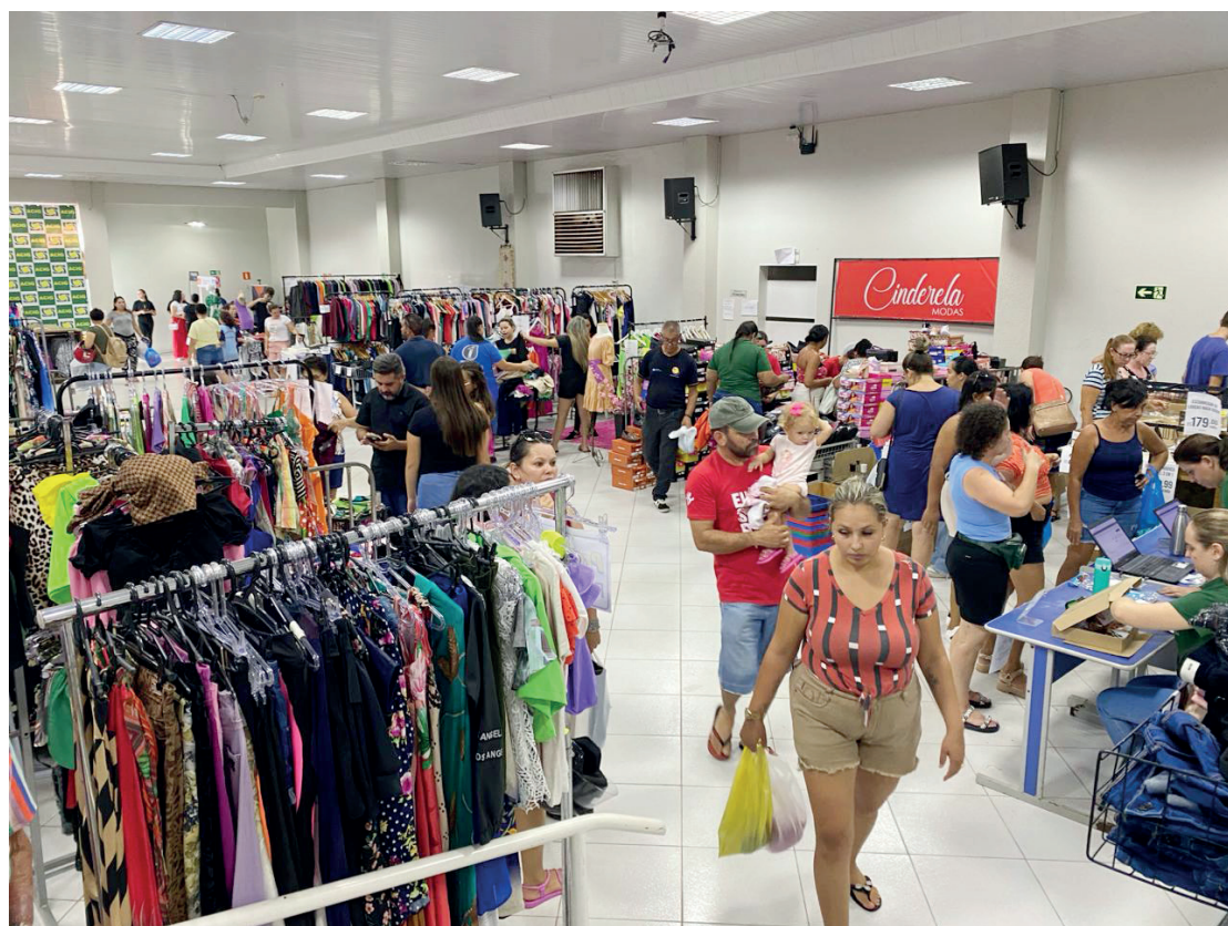
A edição do feirão do Queima termina nesta sexta-feira

Adenilson cita que o feirão conta com vários produtos de qualidade e