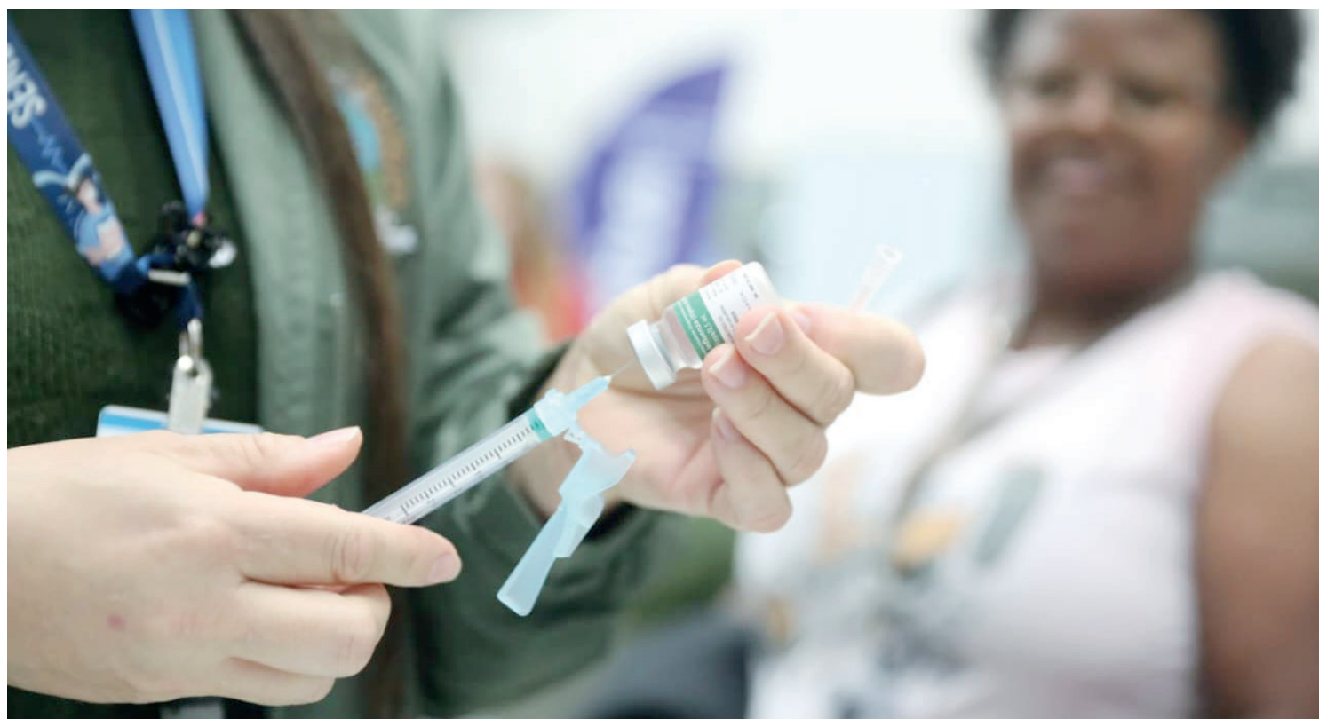
A vacinação vai acontecer neste sábado em Goioerê

A iniciativa busca facilitar o acesso à vacina para quem não consegue ir às unida-